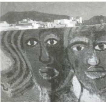
Diferentes zonas del mural