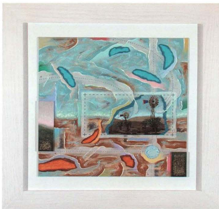
Opus quadratus 11 (Molinos). Técnica mixta sobre cartón entelado. 50 x 50 cm. 1999

dro que no parecían querer guardar una postura bidimensional, sino, por el contrario, abierta, espacial. El conjunto Paisaje con barco surgió desde el fondo de la galería central, avanzando hacia mí, en un mismo cuadro que luego se abriría y multiplicaría en cinco o seis más, donde los elementos que lo componían, barco, torre, veleros o bandera, se descomponían y recomponían situándose en el espacio, jugando igualmente con los colores. Por la derecha, surgió de pronto Paisaje con columna . Un cetáceo de expresión amenazante se situó debajo de mis pies, mientras un conjunto cromático similar a un arco iris esparcía sus colores —violeta, naranja, amarillo, rosado, blanco y marrón— simulando una escalera por donde ví subir dulcemente un tierno unicornio con un pájaro en el lomo. Un león azul me asaltó, sorprendiéndome por el lado izquierdo, pero un sapo amarillo lo deglutió en un santiamén. Del Paisaje con silla , se escaparon tres manzanas, dos sombrillas y un bonsái, al tiempo que un caballito de mar rojo cárdeno, con riesgo de quemarse en una llama, lameteaba la esfinge impertérrita de una mujer con cuerpo de león. Por probar, dije en voz alta “¡omphalos!” y todos los elementos anteriores desaparecieron como por encantamiento. Con Omphalos descubrí que aparecía el hombre en su total desnudez. Allí, al fondo, saliendo de una hornacina divisé un bello cordero que pastaba en el prado del tiempo, mientras más arriba un caballito violeta de noria circulaba sobre uno de los cuadra-