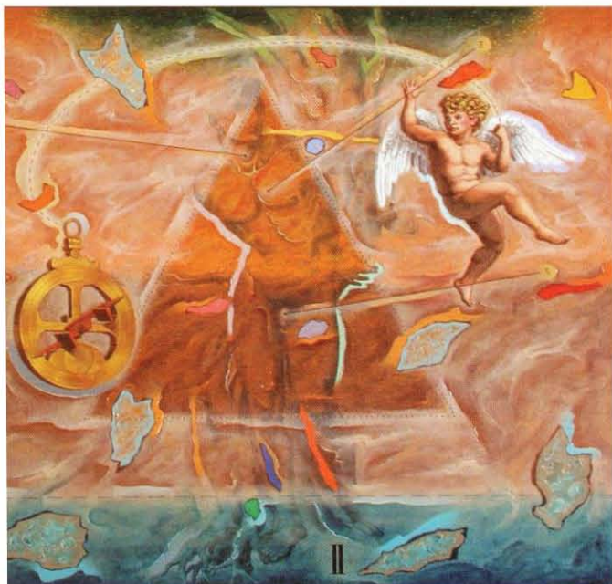
Trípico de San Sebastián mártir (detalle central). Acrílico sobre lienzo. 100 x 100 cm x 3. 1998

—Por otra parte, mi relación con la vieja dialéctica pintura de contenido y pintura pintura , una de esas equívocas oposiciones que recuerdo haber estudiado sobre todo con respecto a los orígenes del arte contemporáneo, me decanté desde mis comienzos por un arte mental , como decía Leonardo, y mi necesidad de decir algo, de comunicar, me ha impulsado a la utilización de la imagen, de la figuración, de recursos narrativos... En este sentido, mis primeras obras nacen en torno a exposiciones-concepto, series que giran alrededor de una idea que se desarrolla en un cierto número de obras englobadas bajo un título. En cualquier caso, a estas alturas este tipo de