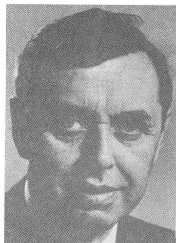
Dr. h.c. Ludwig Poullain