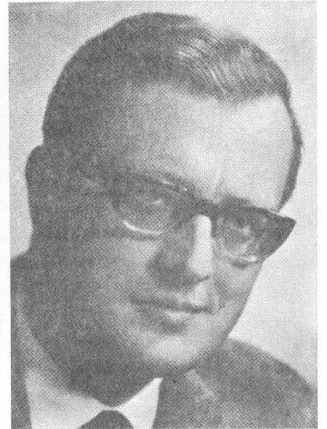
Dr. Josef Taus