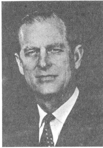
Duque de Edimburgo