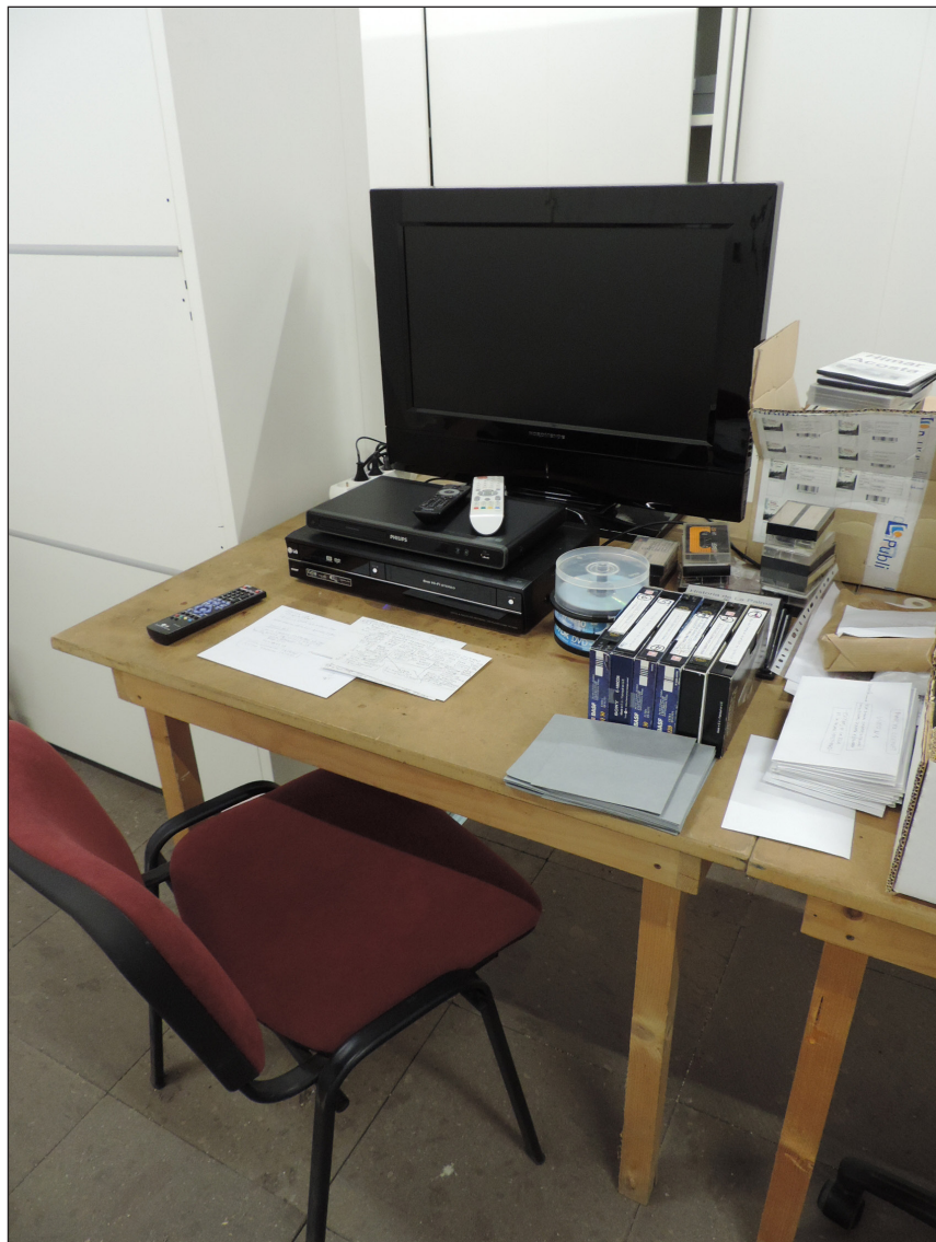
Área de trabajo de películas.