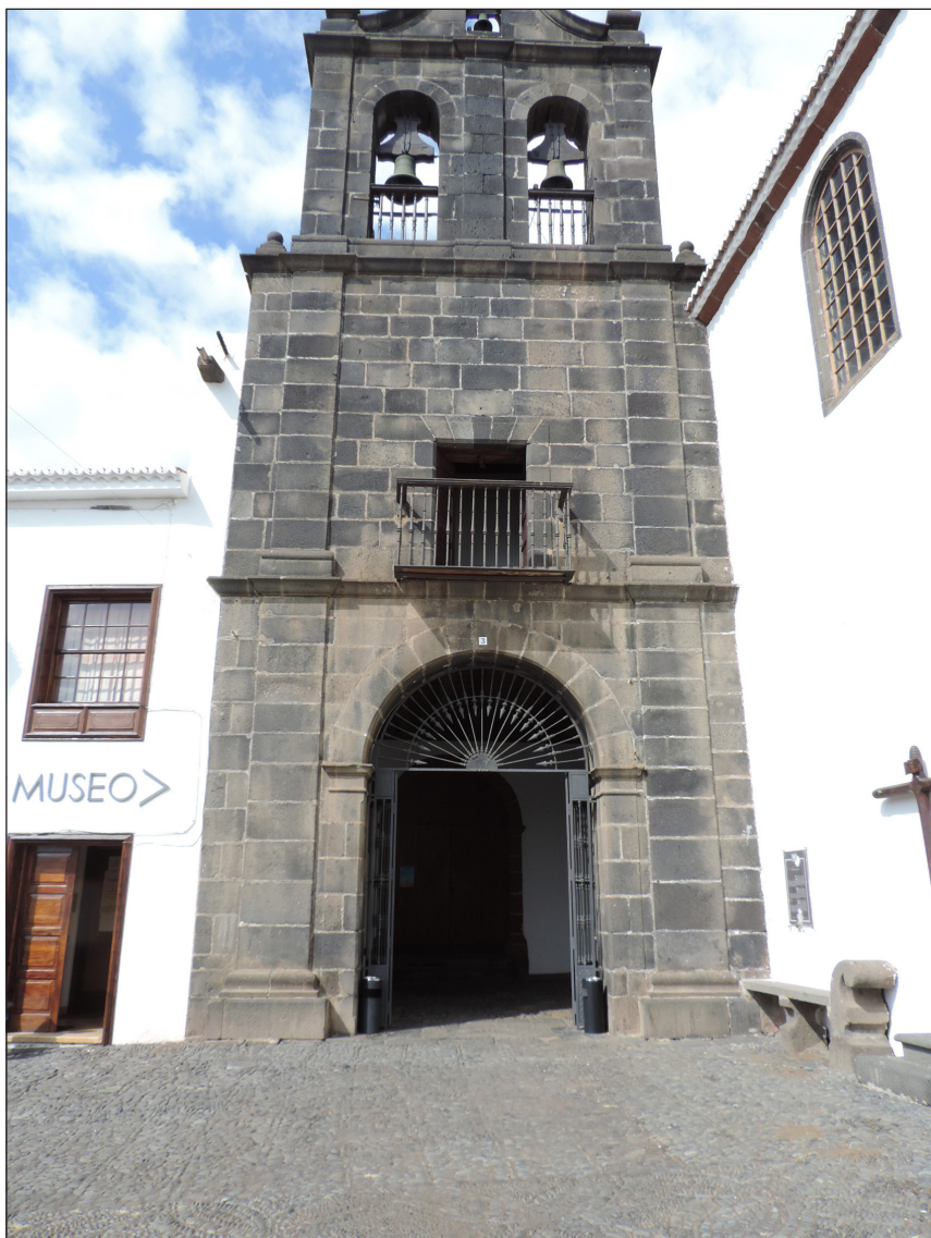
Antigo convento de San Francisco.