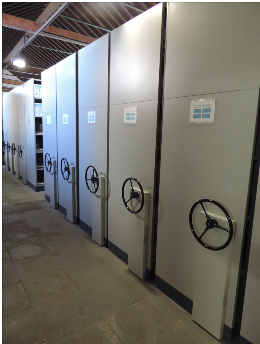
Estanterías compactas del archivo.