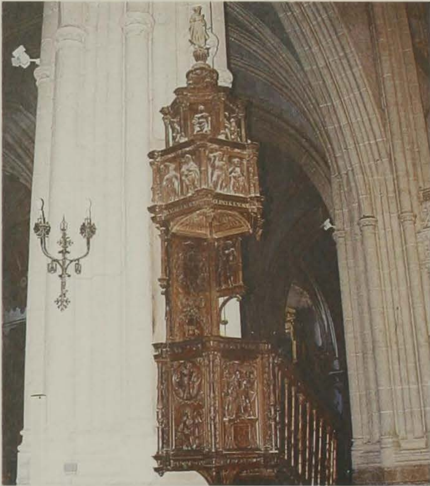
Púlpito del trascoro hecho en madera de nogal visto, obra de Juan Ortiz Cambray, Pedro de Flandes, Andrés Espinosa y Miguel Espinosa. Lleva un gran tornavoz lleno de imágenes, con dibujos de Pedro Torres.