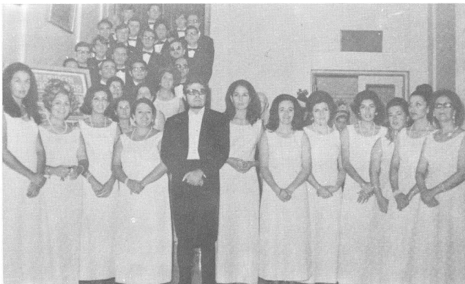
NUESTRA CORAL POLIFONICA

Igualmente, el día 24 de julio, actuó la Coral en las fiestas jacobinas de Gáldar.