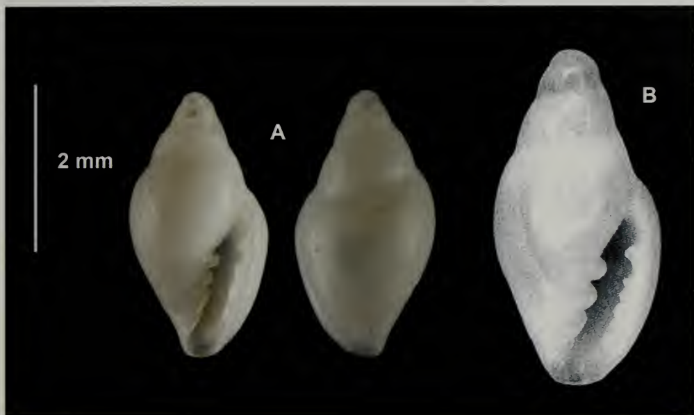
Lámina 1.- A. Neotipo de Dentimargo reductus Bavay (1922); B. Holotipo de Dentimargo redferni especie nueva, tomado de REDFERN [7]. Ambos ejemplares representados a la misma escala.