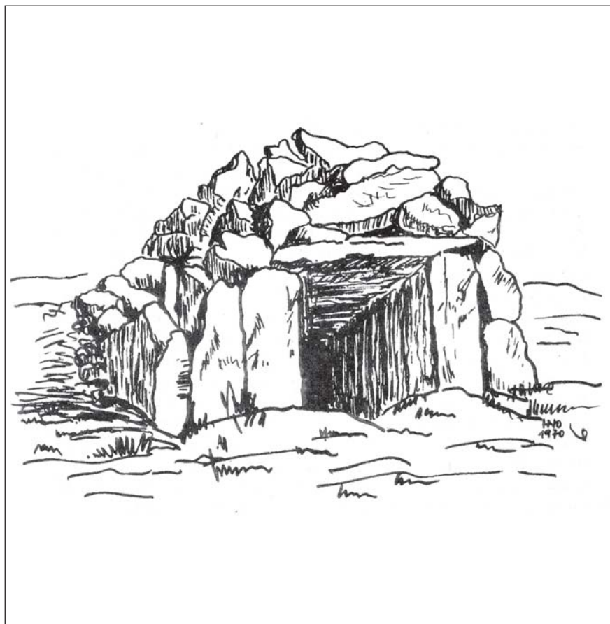
"Casa Honda", Fuerteventura, nach Barker-Webb & Berthelot 1842 (zeichnerische Adaption: Herbert Nowak 1970)

Anmerkung der Redaktion: Casas hondas sind im spanisch-kanarischen Sprachgebrauch den Ureinwohnern (Altkanariern) der Ostinseln eigene Wohnbauten, die halb im Erdreich und halb oberirdisch angelegt sind; letzteres wird durch einen Trockensteinbau – wie oben zu sehen – gebildet. Auf Fuerteventura und Lanzarote kann eine casa honda (wörtlich übersetzt "tiefes [bzw. tiefangelegtes] Haus" auch aus einer natürlichen Gasblase unter einer Lavadecke und einem nur rudimentären Trockensteinbau bestehen, der aus wenigen Steinen zusammengefügt ist und quasi ein kleines Portal oder einen simplen Windschutz darstellt. Man spricht dann auch von einer " casa honda falsa ".