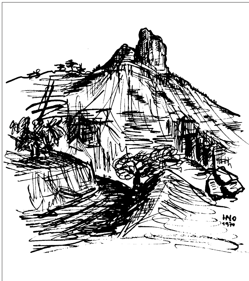
Roque Bentaiga, Gran Canaria (Zeichnung: Herbert Nowak 1970)

Anmerkung der Redaktion: Der Bentaiga-Felsen (Name aus der Sprache der Ureinwohner) ist ein Höhenheiligtum der Altkanarier von Gran Canaria. Zu beobachten ist ein Kultplatz mit Libationsrinnen sowie libysch-berberische Felsinschriften. Beides hat vermutlich nicht das gleiche Alter; die jüngeren Inschriften, die noch nicht befriedigend gelesen bzw. übersetzt wurden, könnten aber ebenso einen Bezug zur Wertigkeit des Felsens als hochgelegener, numinoser Platz haben. hju 2009