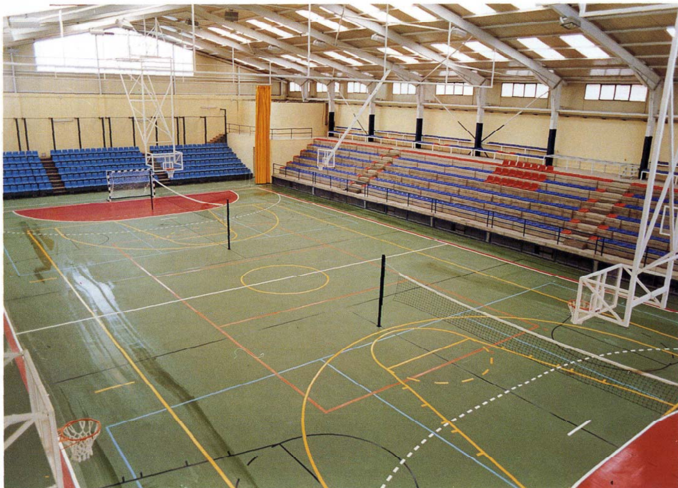
Pabellón de Las Remudas (Telde), construido por el Cabildo e inaugurado a comienzos de este año

La Corporación ha puesto en marcha varias escuelas insulares a través de convenios con diferentes federaciones