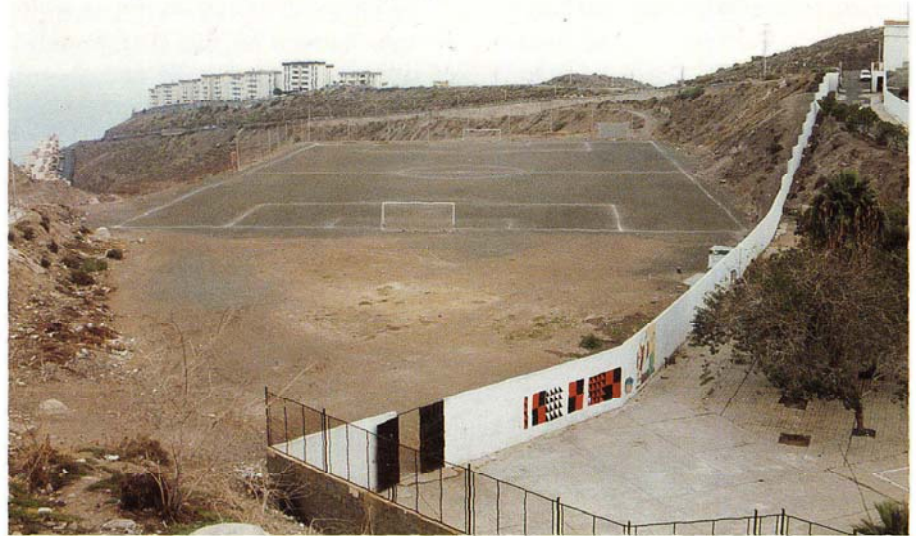
Complejo Deportivo «El Lasso»

La escuela de lucha canaria, que se encuentra dentro del recinto del