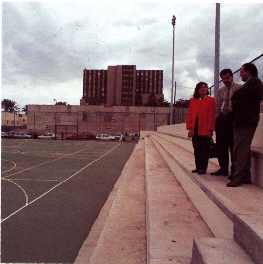
Cancha de la Universidad

En cuanto al atletismo, hay ya ocho núcleos, con sus respectivos monitores, repartidos por toda la isla. ●