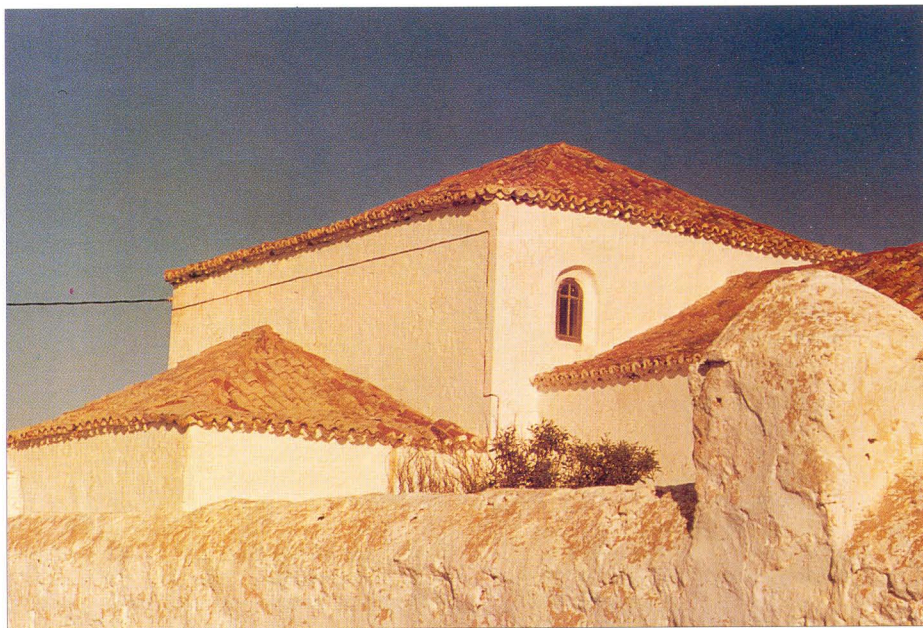
Ermita de San Pedro Alcántara (Detalle del Presbiterio), Ampuyenta, 1681.

mente de tipo privado o familiar, es decir por personajes de cierta relevancia en el ámbito insular (son los casos de las ermitas de Agua de Bueyes, Ampuyenta o Tostón).