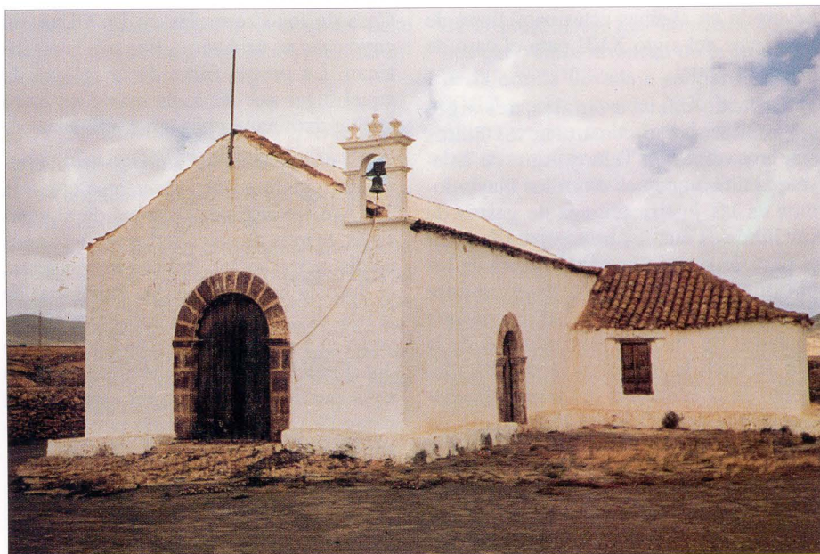
Ermita de San Francisco Javier (Las Pocetas), 1771-1775.