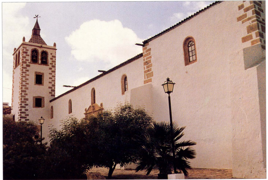
Iglesia Matriz de Santa María de Betancuria, reconstrucción siglo XVII.

Fue fundada por el vecindario y bendecida el 17 de marzo de 1715; hacia 1730-40 se enlosa la ermita y a finales de la centuria se la rodea del muro almenado que hoy vemos. Es de una nave con