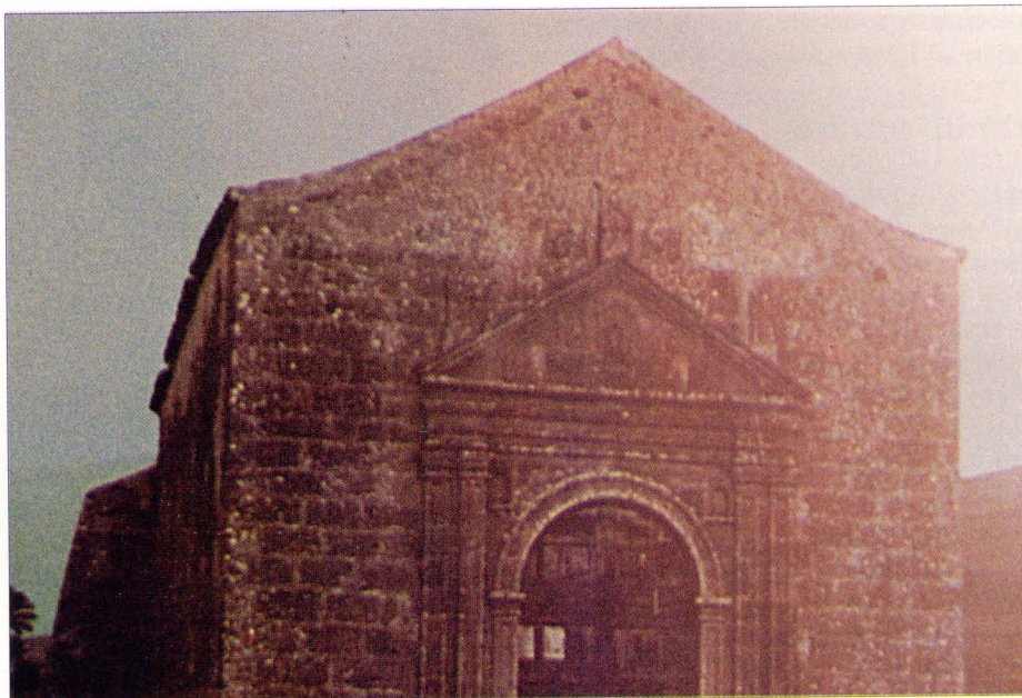
Desaparecida Ermita de San Sebastián (Vega de Río Palma), siglos XIV-XV. Del tomo Historia de Canarias, Arte, colección Millares Torres, Edirca.