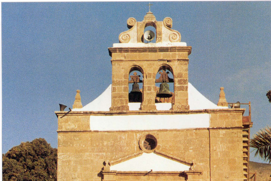
Santiago de Ntra. Sra. de La Peña (Vega de Río Palma), siglo XVII.

Las barbacanas o muros almenados que rodean actualmente algunas ermitas (San Diego de Alcalá de Betancuria, Tiscamanita, Triquivijate, Ampuyenta y Tefía) datan del siglo XVIII, salvo la de San Diego, que es de la centuria anterior. Este elemento arquitectónico que pudo tener un carácter defensivo si observamos cómo en el siglo XVI lo tenían también las primitivas ermitas de Tuineje y Antigua, que, según los documentos de la época, se encontraban extramuros y muy alejados de la Villa Capital, atendidas por sendos ermitaños que se aventuraban a residir en aquellos lugares. Si bien es cierto que durante el siglo XVI se produjeron incursiones berberiscas en nuestra isla, lo único que denuncian los mayordomos de ermita ante el obispado son las fiestas que se montaban durante las noches en las ermitas, como la de Antigua, donde se decían “cantares deshonestos y allí se bailaba y dormía”, y acaso podríamos relacionarlo con el elevado porcentaje de población morisca, también