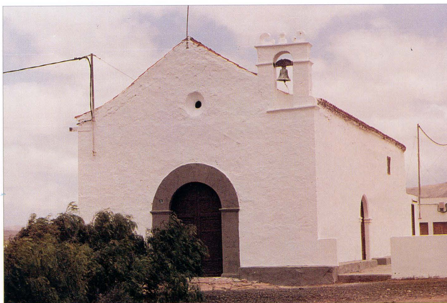
Ermita de Ntra. Sra. de la Concepción (Llanos de la Concepción), 1793.