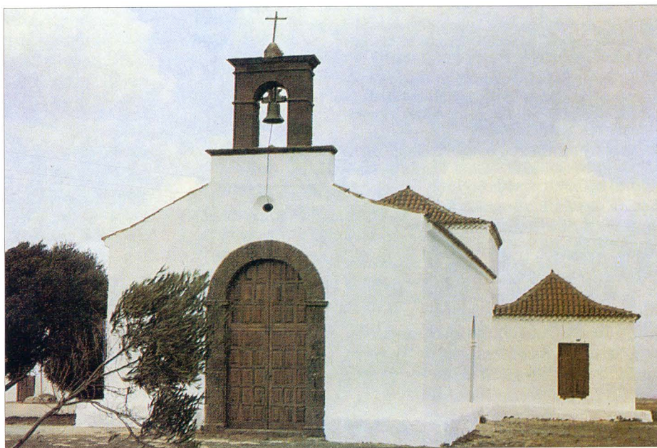
Ermita Ntra. Sra. de las Mercedes (El Time), siglo XVIII.

En el trabajo de referencia de este artículo, y con este epígrafe le dedicamos unos párrafos a numerosas ermitas que lamentablemente no nos llegaron y que, en esta ocasión, nos limitaremos a reseñar. Son estas: Ntra. Sra. del Rosario, La Oliva (siglo XVI-XVII); Ntra. Sra. de Gracia, Vallebrón (principios del XVII); San Andrés, Valle de la Sargenta, Tetir , (mediados del XVII, construida a raíz de erigirse a San Andrés como patrono de agricultores en acuerdo del cabildo de 1609); Santa Catalina, Betancuaría , de la primera mitad del XVI, tuvo varios enclaves y azarosa existencia, siendo el último que bautizó el actual Llano de la Santa, al poniente de la Villa; San Salvador del Mundo , existía al menos en 1560, a la derecha del cami-