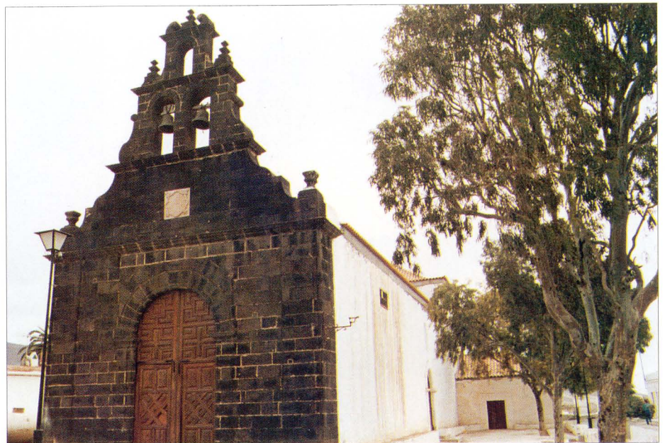
Iglesia Parroquial de Santa Ana (Casillas del Ángel), 1750-1781.

Víctima del expolio, perdió sus tejas a finales del XIX, y hoy es la más solitaria