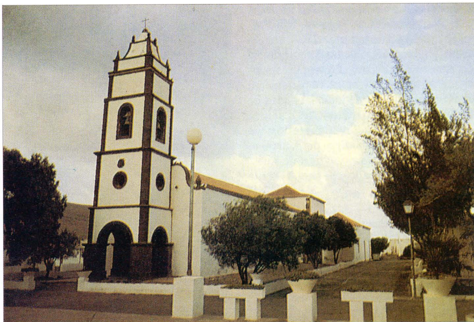
Ermita de San Andrés (Valle de la Sargenta), siglo XVII.

— Parroquia de SAN MIGUEL ARCÁNGEL, Tuineje. Tras la reestructuración de jurisdicciones parroquiales de los obispos Martínez de la Plaza y Antonio Tavira, a finales del XVIII surge esta iglesia ampliándose la primitiva ermita. Aquella ermita ya existía posiblemente antes de 1700 y, a juzgar por las pinturas del banco de su retablo, evocadoras del ataque inglés de 1740, en esas fechas contaba con las líneas clásicas de nuestras ermitas: una sola nave y, antes de ampliarse (como en el caso de la de Anti-