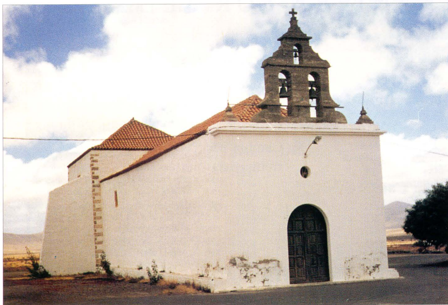
Ermita de San Roque (Casillas de Morales - Valles de Ortega), 1732.

b) Durante el siglo XVIII, tras la erección de los curatos de Pájara y La Oliva (1711), surgen entorno a ellos un rosario de pequeñas ermitas fundadas por los vecinos de cada lugar. Se amplían las