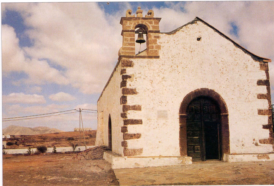
Ermita de Santa Inés (Valle Santa Inés), reconstrucción del siglo XVII.

advertido en algunas actas cabildicias de principios del siglo XVII para el caso de la Villa Capital.