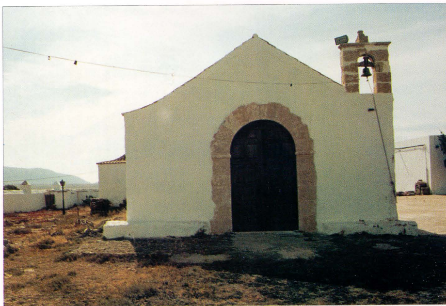
Ermita de San Isidro Labrador (Triquivijate), 1715.