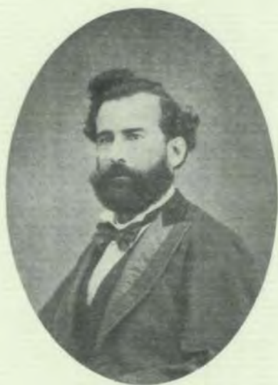
MIGUEL PEREYRA DE ARMAS

(Arrecife de Lanzarote 1841-Santa Cruz de Tenerife 1908)