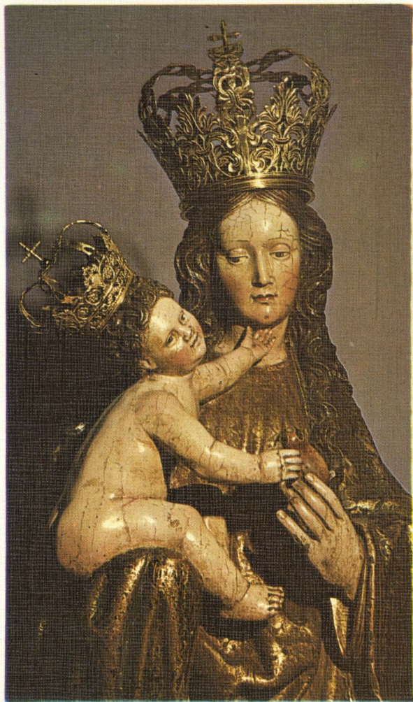
Virgen de los Remedios