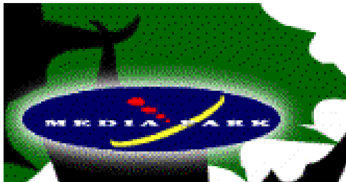
Ilustración: Logotipo de Media Park

Otro de los argumentos de sus creadores para la puesta en marcha de este canal es el hecho de que los consumidores se muestran hoy más sensibles a los temas globales, están mejor informados y son más difícilmente influenciados por mensajes vacíos. Estos esperan de las empresas que participen en la construcción de un mundo mejor y empiezan a exigir comportamientos éticos asociados a sus productos. Por su parte, las empresas han comenzado a desarrollar una serie de actuaciones éticas, distintas de las filantrópicas, que establecen un vínculo de relación, sólido y duradero entre la marca o empresa y sus consumidores a través de la asociación común a una causa de interés social, ecológico y cultural. (3)