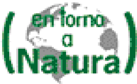
Ilustración: Logotipo que identifica el espacio de programación propia dedicado a reportajes de actualidad denominado En torno a Natura.

La programación se completa con entrevistas y debates con personalidades, intelectuales, ONG's medioambientales y otros agentes de interés. Canal Natura pretende servir como foro en el que se debatan asuntos de interés, tanto de actualidad como de temas de fondo relacionados con el medio ambiente.