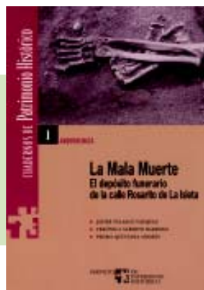
Números 1 y 2 de la Serie Cuadernos de Patrimonio Histórico, publicados en el año 2003.