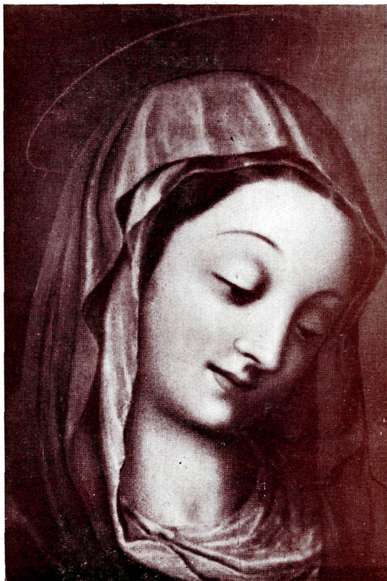
NUM. 34. – Cabeza de la Virgen

POR LUIS DE MORALES, «ÉL DIVINO» (1509 1586).