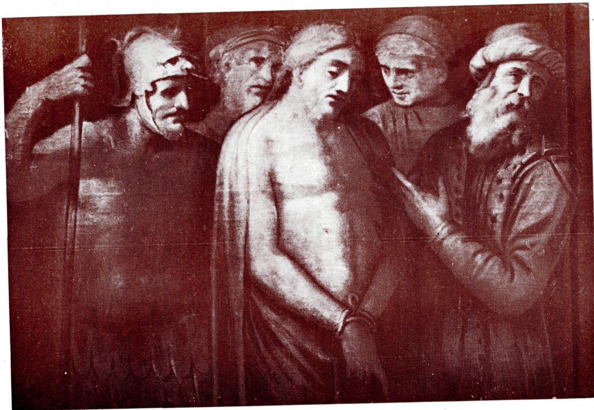
NUM. 43.-- Cristo entre sus verdugos POR POLIDORO CALDARA, «EL CARAVAGGIO» (1492-1543).