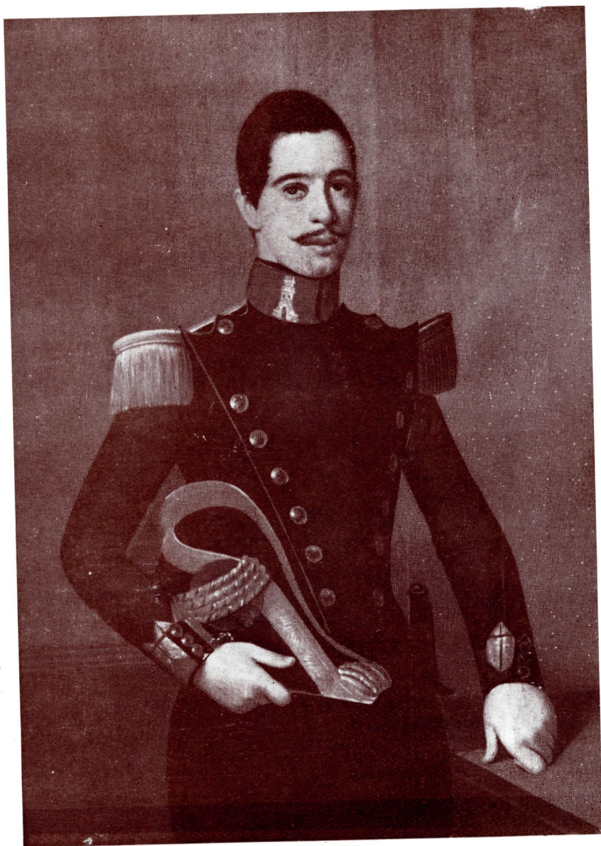
NUM. 39.—Retrato de un oficial de Ingenieros