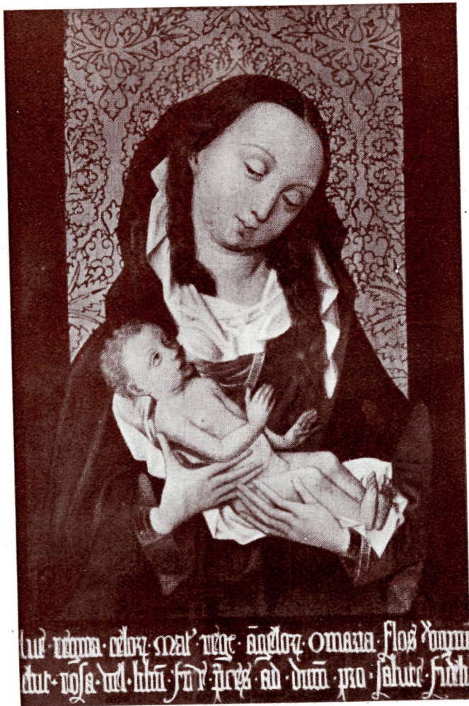
NUM. 31.--La Virgen y el Niño