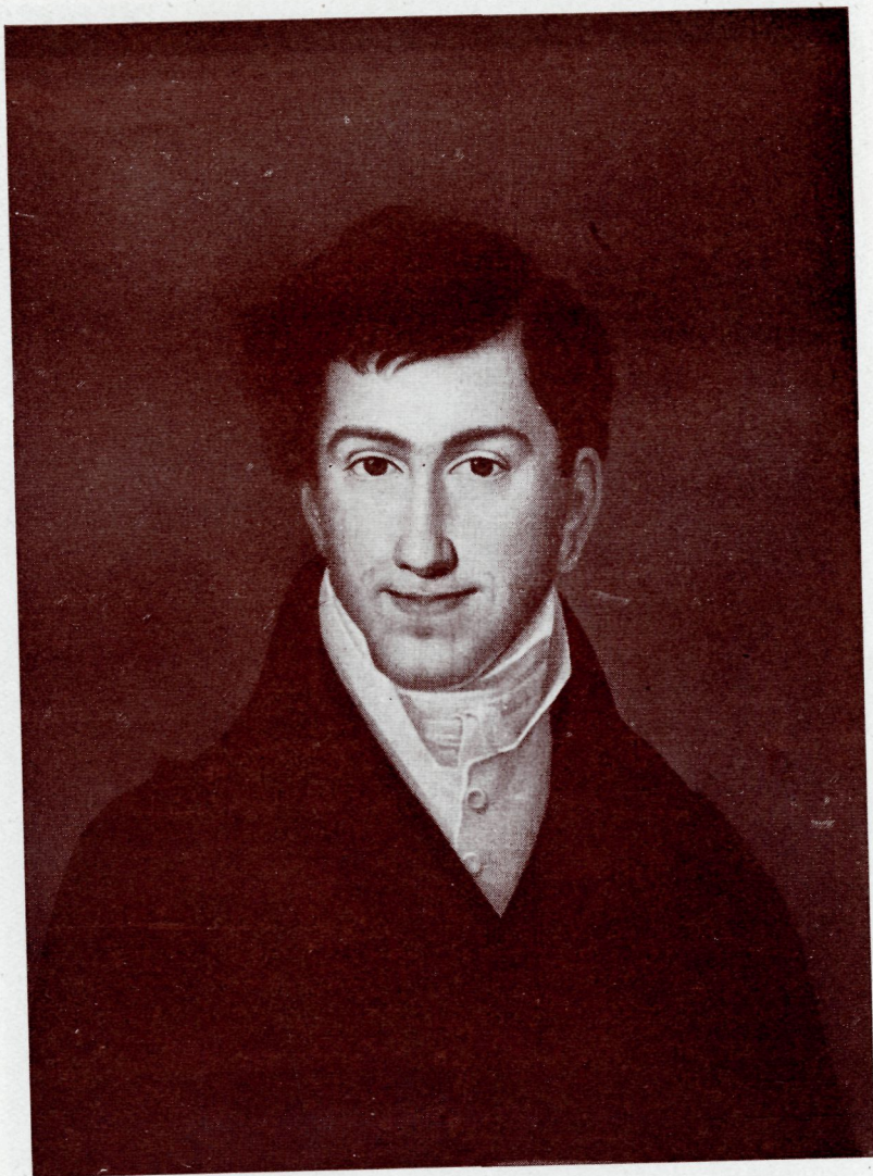
NUM. 27.—Retrato de un joven señor POR ANTONIO MARIA ESQUIVEL (1806-1857).