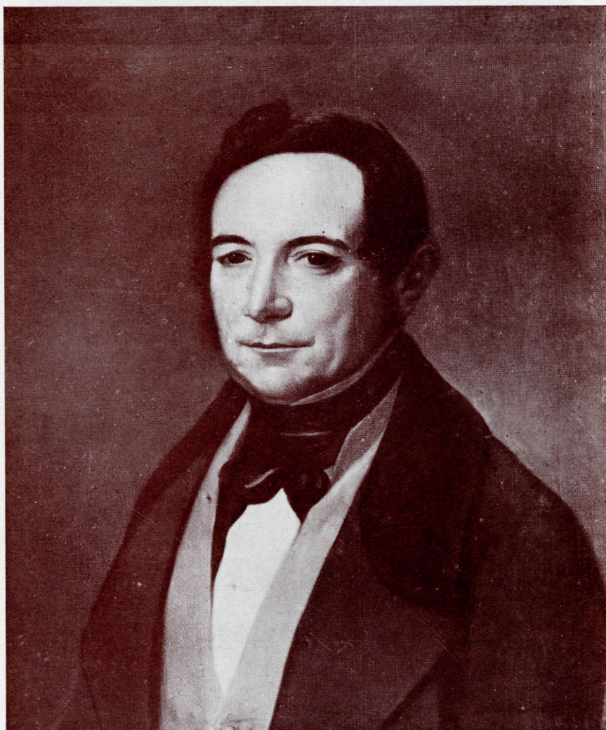
NUM. 26.—Retrato de caballero

Por JOAQUÍN MANUEL FERNÁNDEZ CRUZADO (1781-1856).