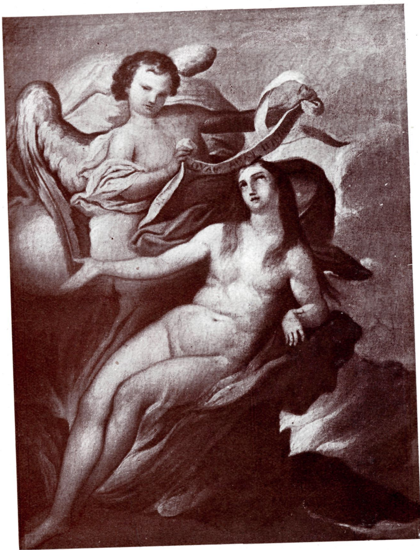
NUM. 42.—Un ánima en el Purgatorio