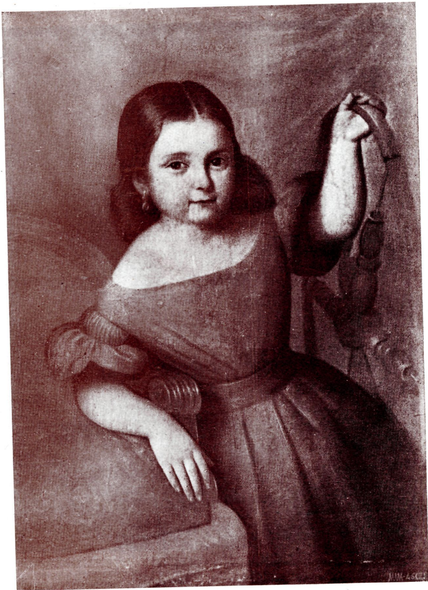
NUM. 28. — Retrato de una niña