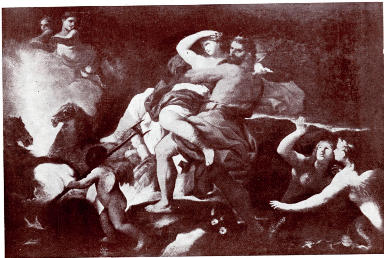
NUM. 25.—El rapto de Proserpina Por LUCA GIORDANO (1632-1705).