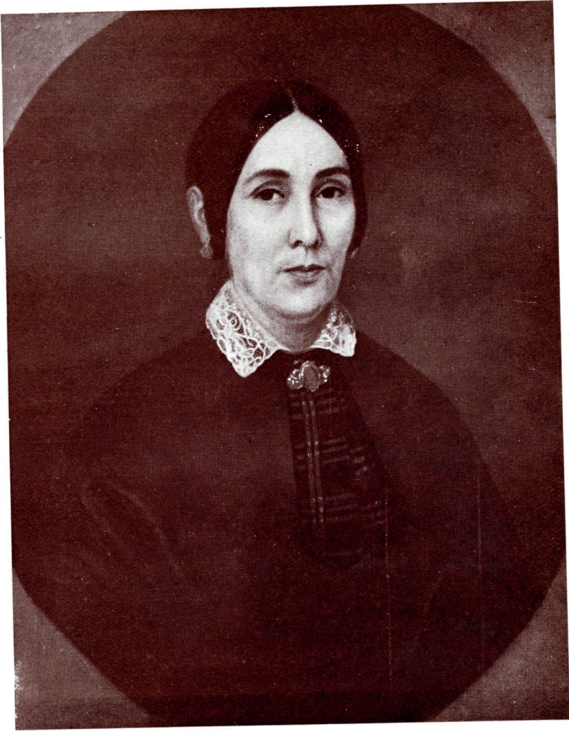
NUM. 29. - Retrato de señora