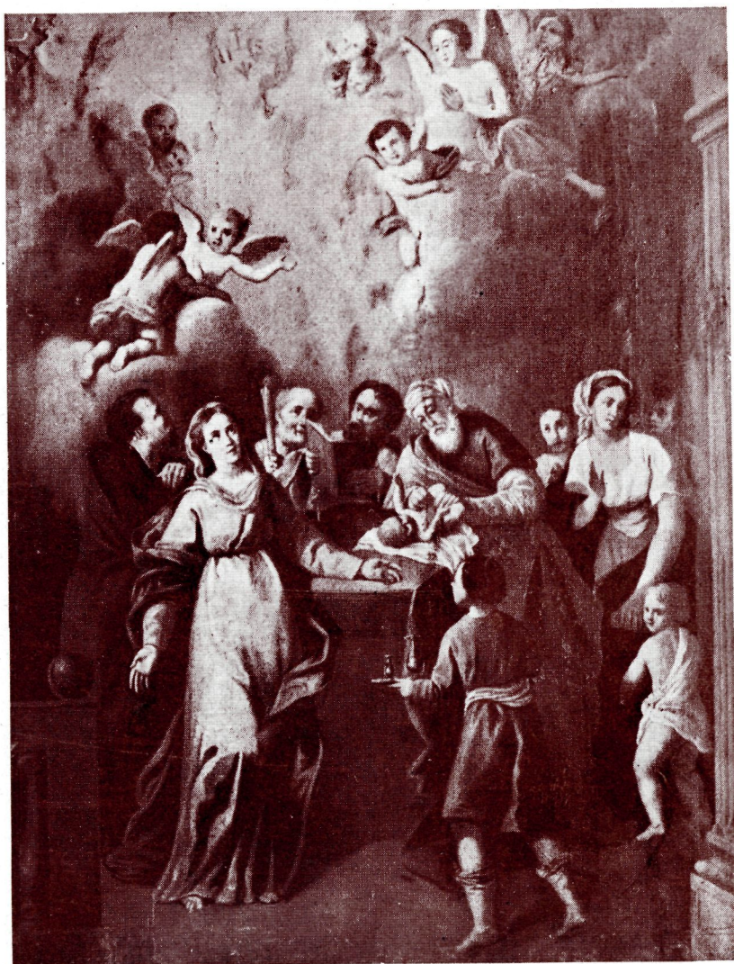
NUM. 50.—La Circuncisión del Señor

Anónimo. Escuela italiana del siglo XVII.