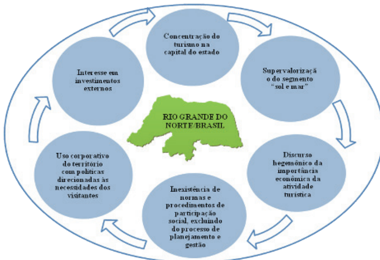
Figura 01: Características do processo de desenvolvimento turístico no Rio Grande do Norte

Com base no exposto, desenham-se, na figura 01, algumas características do processo de desenvolvimento turístico norte-rio-grandense que foram explicitados correlacionando com o uso do território turístico baseado em relações de poderes.