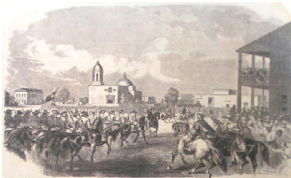
Alarde militar en la plaza principal, actualmente de Las Islas, en San Antonio de Tejas. Se observa al fondo la fachada de la antigua parroquia. Grabado del siglo XIX

familias más principales algunos solares colindantes con la mencionada plaza. Además había que tenerse en cuenta -en dicho reparto de solares- la obligación de asignar tierras de cultivo en los alrededores de la zona poblada, tanto por parte de estas familias fundadoras como por las que se quisieran agregar en el futuro inmediato. Se recordaba la necesidad de que las calles presentaran una anchura de cuarenta pies y de que el suelo urbano, dividido en doce cuadras por sector, debía trazarse en dirección a los cuatro vientos o puntos cardinales con una extensión de 1.090 varas usuales , contadas a partir de la puerta de la parroquia, la cual originará el centro del plano en cruz.