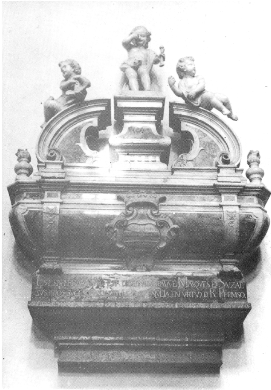
Sepulcro del marqués del Sauzal.