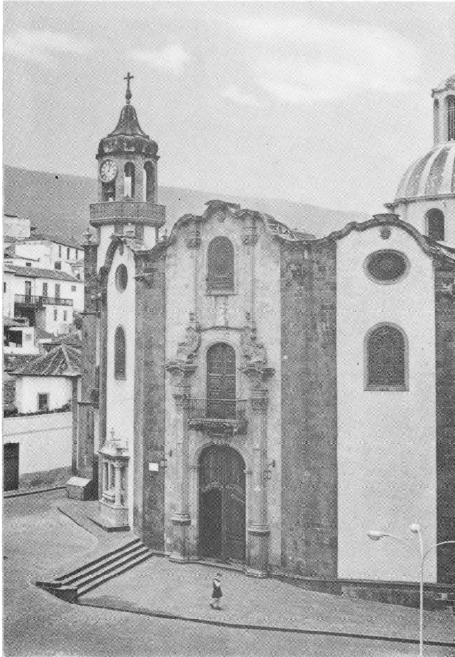
Fachada de la Iglesia de la Concepción.