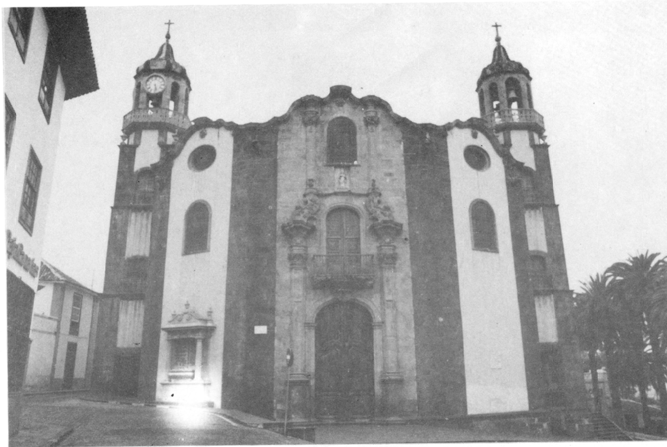
Vista panorámica de la Iglesia de la Concepción.