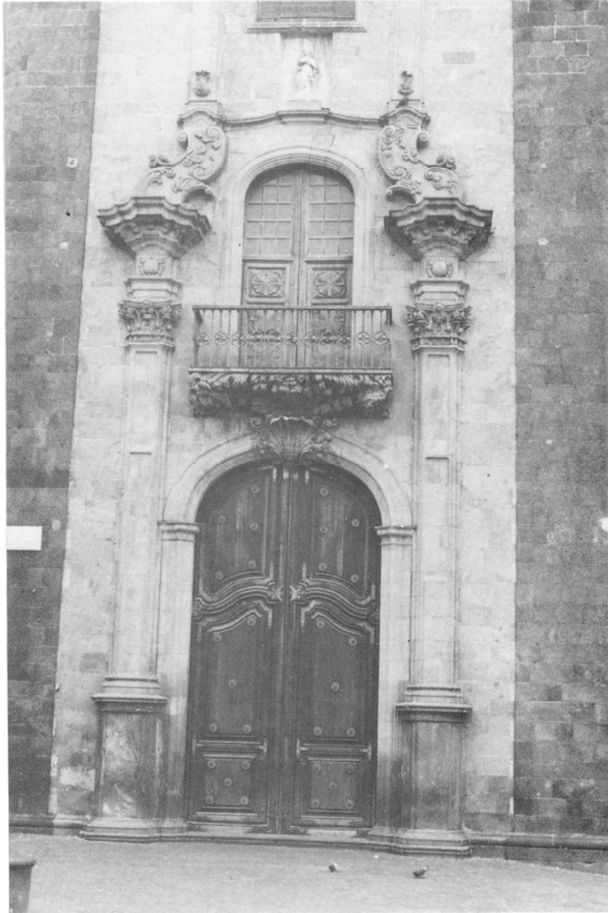
Puerta principal de la Iglesia de la Concepción.