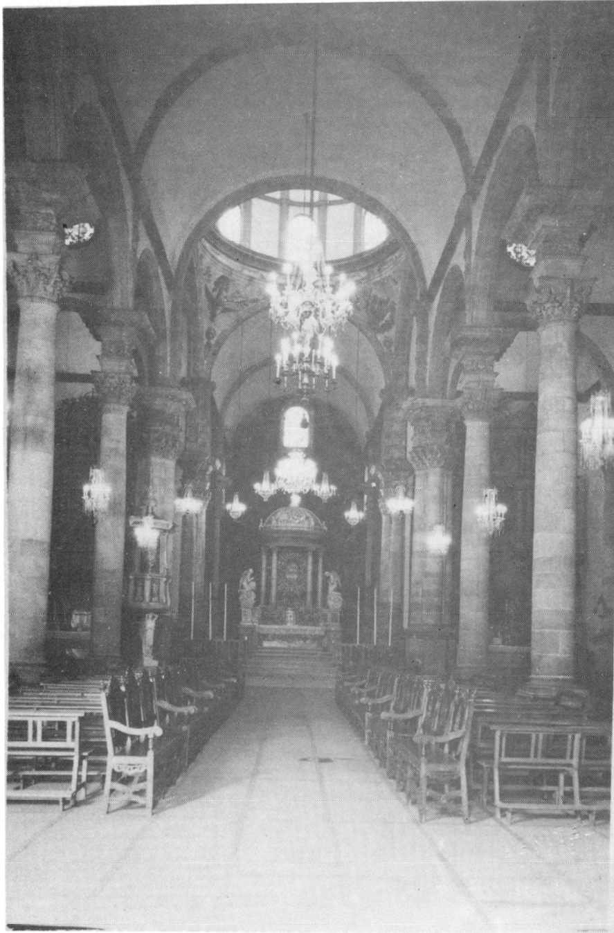
Interior de la Iglesia de la Concepción.