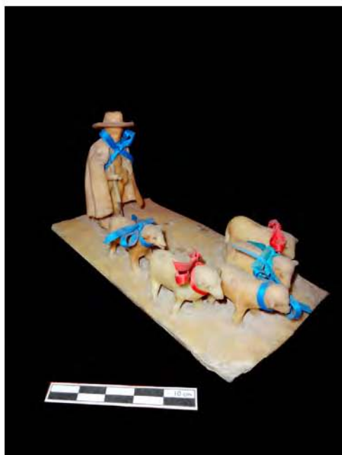
Foto 3. Exvoto de cera «escénico» (Ermita de San Antonio Abad. La Matanza de Acentejo).

Igualmente, aunque la pieza votiva se mantiene en su color natural, las figuras presentan restos de policromía en ojos y bocas. [Foto 3]