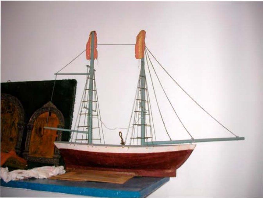
Foto 6. Barco votivo para colgar (Iglesia de Ntra. Sra. del Socorro-Tegueste).

En lo concerniente a su tipología, y sin menoscabo de lo que exponen algunos autores 76 , estableceremos dos clasificaciones: