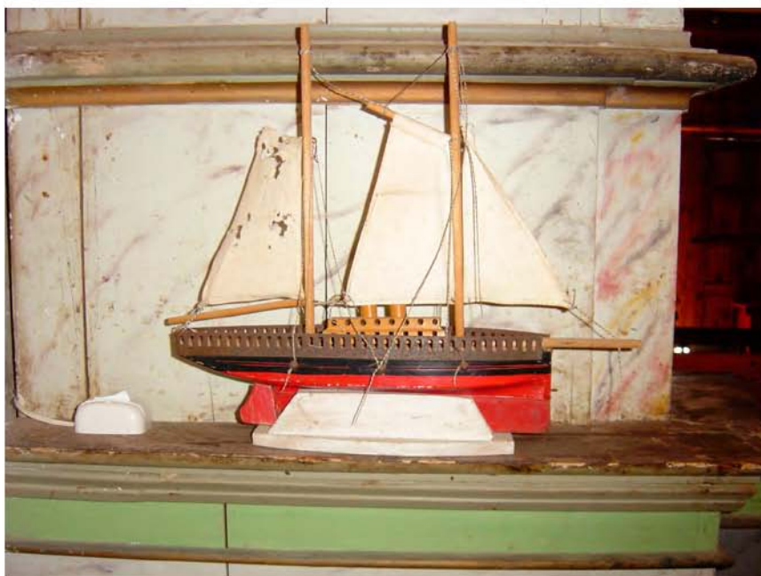
Foto 7. Barco votivo sobre peana. (Ermita de Ntra. Sra. de Los Reyes-Garachico).

nistrativos y lonjas. Esta variedad de exvoto es ejecutado para contemplarse sin ningún obstáculo visual 77 . [Foto 6]