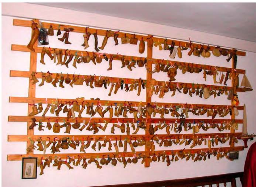
Foto 4. Panel de exvotos (Iglesia de Ntra. Sra. del Socorro-Tegueste).

un evidente cambio sustancial de actitud de los devotos ante la imagen sagrada 44 . [Foto 4]