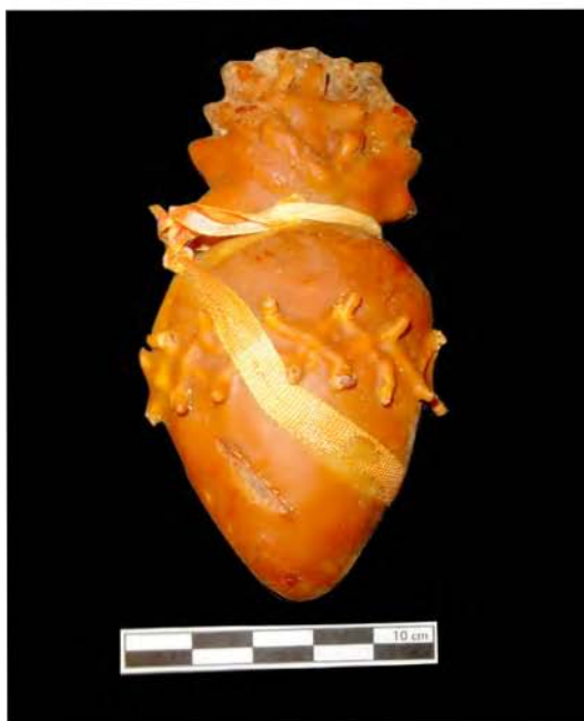
Foto 5. Exvoto dedicado al «Gran Poder de Dios» (Iglesia de Ntra. Sra. de la Peña de Francia-Puerto de la Cruz).