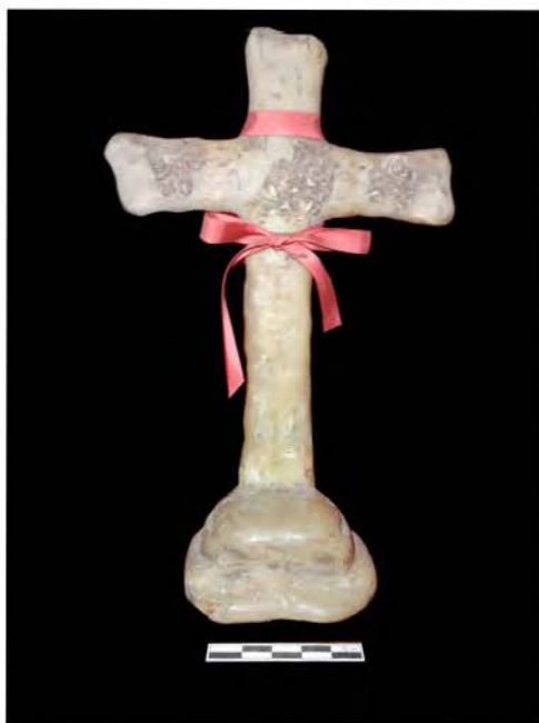
Foto 2. Exvoto de cera (Ermita de San Antonio Abad. La Matanza de Acentejo).

bastante desgastada, cuarteada y con pérdidas considerables de cera en algunos puntos. [Foto 2]