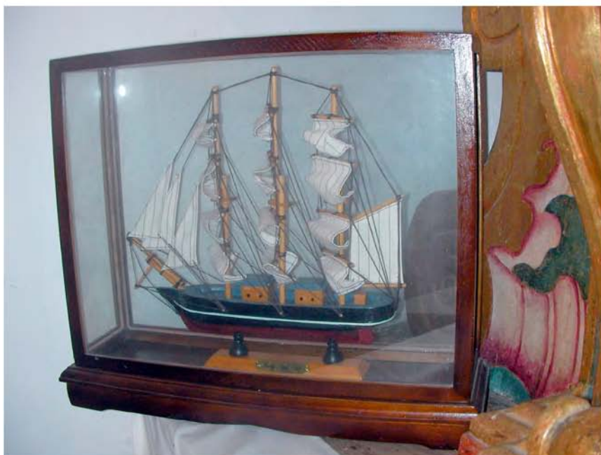
Foto 8. Barco votivo en una urna (Ermita de San Telmo-Santa Cruz de Tenerife).