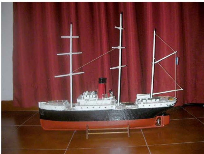
Foto 14. Exvoto del vapor Flachat (Iglesia de Ntra. Sra. de las Nieves-Taganana).

hundimiento destacan dos efigies de bulto que representan a un Crucificado 92 y una Inmaculada Concepción 93 , imágenes que en la actualidad reciben culto en la parroquial de Taganana.