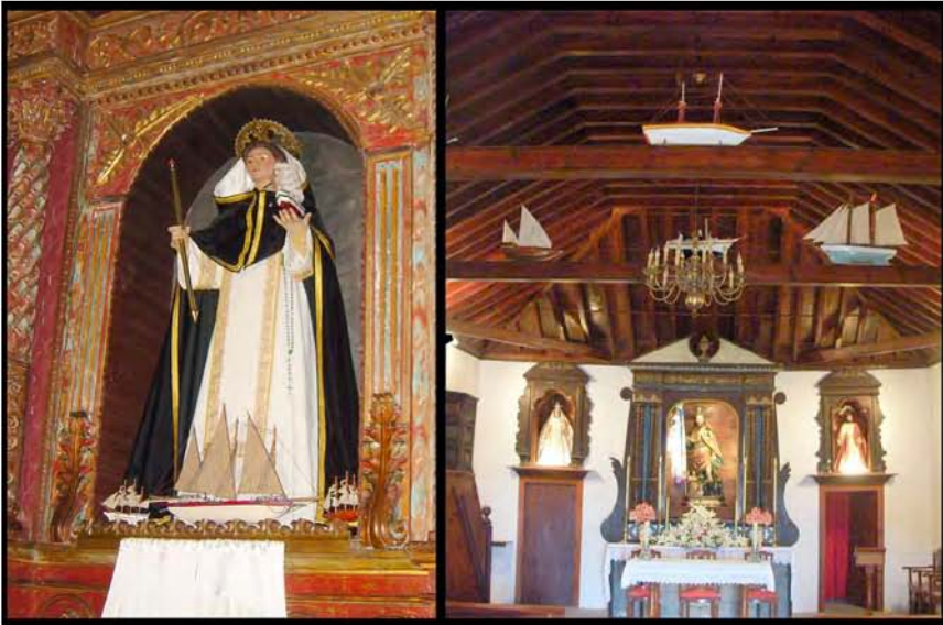
Foto 12. Izq. : San Telmo con barcos votivos a sus pies (Ermita de San Telmo-Puerto de la Cruz); Der. : Barcos votivos dispuestos sobre los tirantes (Ermita de San Roque-Garachico).