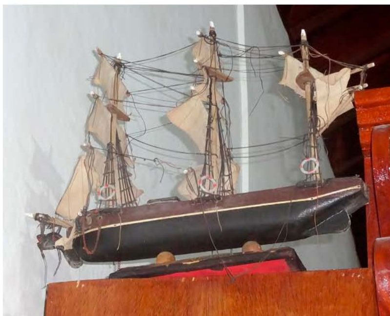
Foto 9. Barco votivo popular (Ermita de Ntra. Sra del Rosario-Machado-El Rosario).