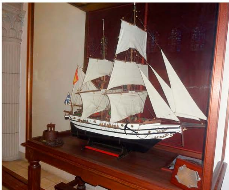
Foto 13. Exvoto del bergantín redondo El Audaz (Iglesia de Ntra. Sra. del Carmen-Los Realejos).

fenómeno meteorológico que evidentemente alude a la calima o polvo sahariano en suspensión y que también fue la causa de otros desastres similares acaecidos en las aguas de Canarias 91 . Asimismo, entre los restos que se pudieron rescatar del