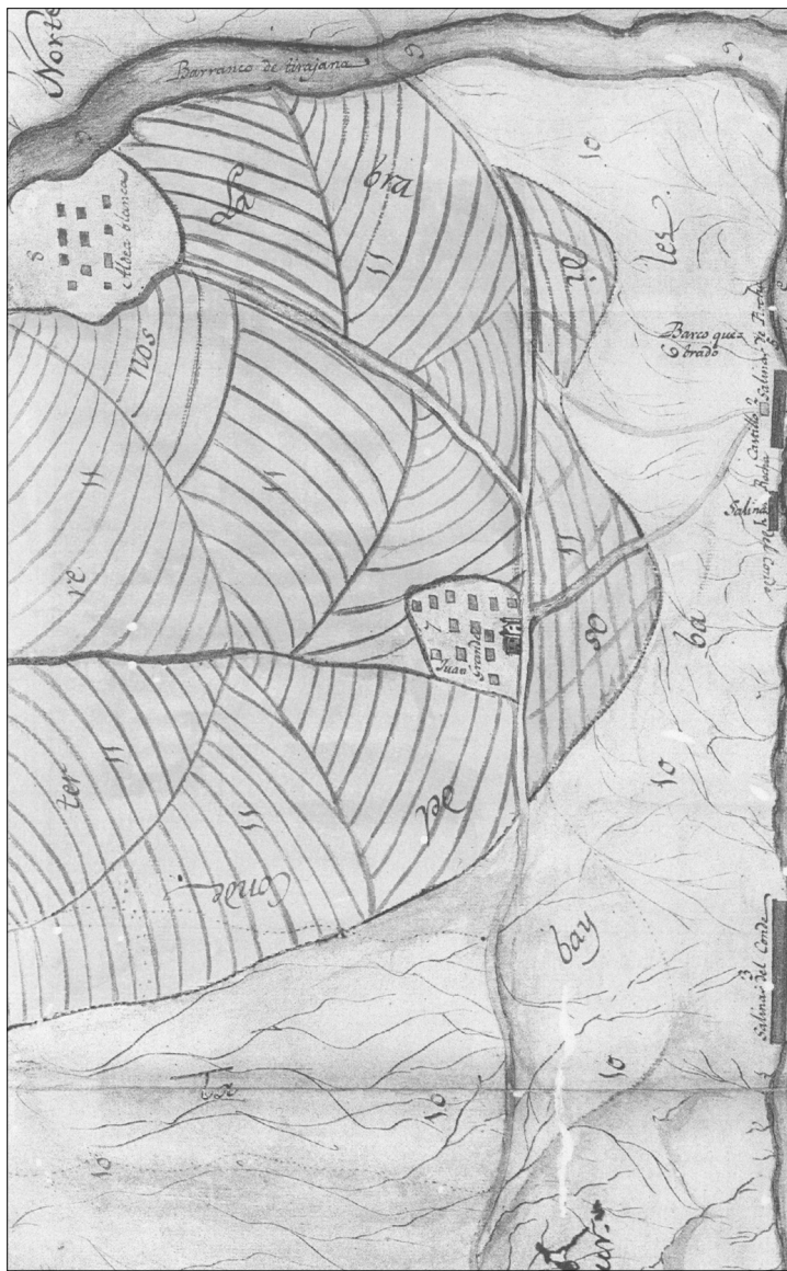
MAPA 1.—SITUACIÓN DE LA INDUSTRIA SALINERA DE GRAN CANARIA A FINALES DEL SIGLO XVIII.