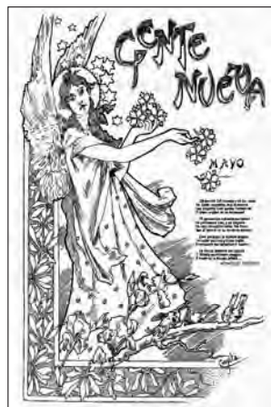
Ilustración de CROSITA para el poema Mayo de LUIS RODRÍGUEZ FIGUEROA, nº 73, 12 de mayo de 1901

Durante la Gran Guerra (1914-1918), la sociedad canaria se pronuncia a favor de uno u otro bando, pro-alemán o pro-aliado. Esta toma de posiciones llega al punto de inspirar poemas a Tomás Morales y Domingo Rivero que evocan en su lírica el estilo y emoción de los poetas británicos de la Gran Guerra (Siegfried Sassoon y Wilfred Owen). La información que se maneja sobre el desarrollo de las campañas bélicas en el continente es mucho más extensa de la que proporciona las crónicas de La Esfera a la sociedad española. A los puertos canarios y, por tanto, a sus hoteles y clubes llega el Times y el Illustrated London News , y Néstor Martín Fernández de la Torre se abona a principios de 1920 a la prestigiosa revista The Studio , que le mantiene al tanto de las exposiciones de la Whitechapel, Burton y Grafton Galleries, y las últimas tendencias del simbolismo nórdico.