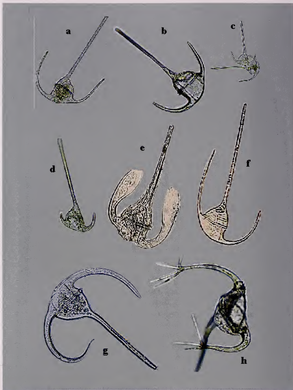
Lámina 4. a)-c) Ceratium tripos distintas formas, a)-b) 200X y c) 100X. d) Ceratium pulchellum vista dorsal, 200X. e) Ceratium platycorne vista ventral, 400X. f) Ceratium euarcuatum vista dorsal, 400X. g) Ceratium arietinum gracilentum vista dorsal, 400X. h) Ceratium ranipes vista ventro-ántapical, 400X.