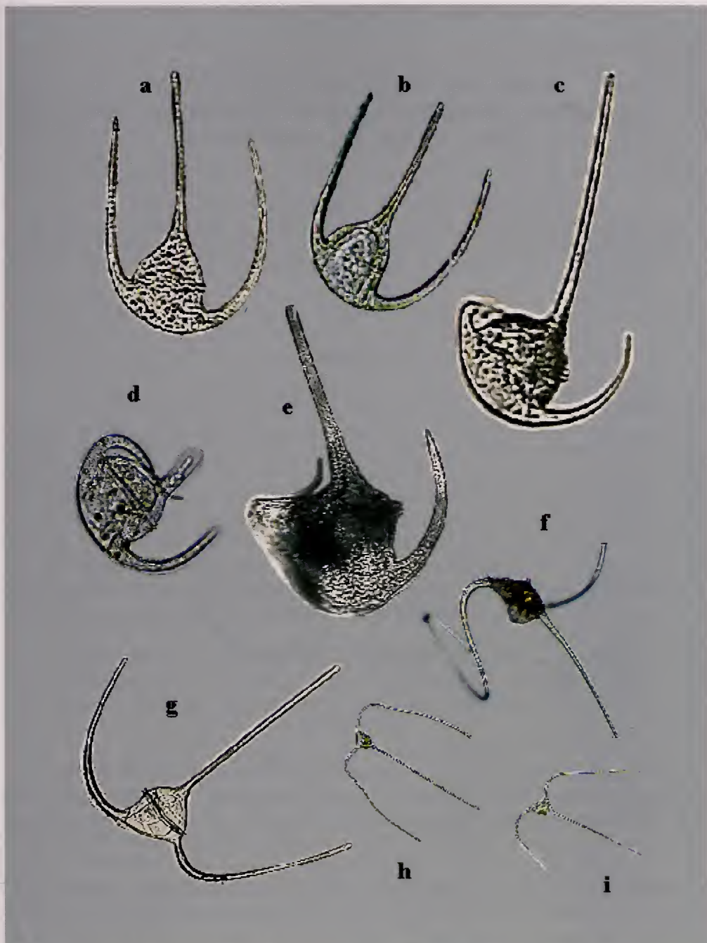
Lámina 5. a)-b) Ceratium symmetricum vista dorsal y ventral, 200X. c) Ceratium concilians , 200X. d) Ceratium concilians 400X. e) Ceratium gibberum , 400X. f) Ceratium hexacanthum , 200X. g) Ceratium massiliense vista dorsal, 200X. h) Ceratium massiliense , 100X. i) Ceratium macroceros , 100X.