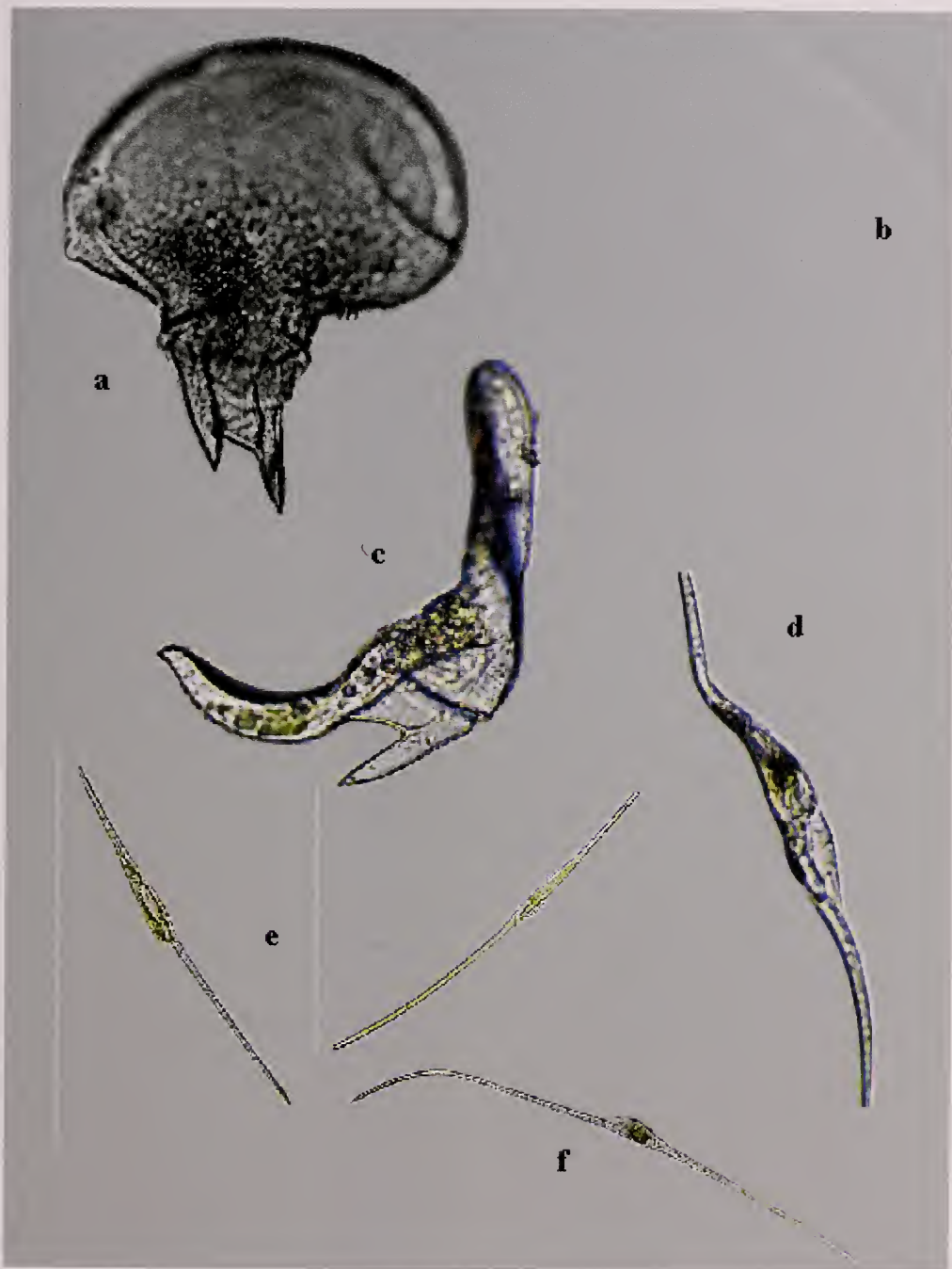
Lámina 1. a) Ceratium cephalotum vista ventral, 200X. b) Ceratium gravidum vista dorsal, 200X. c) Ceratium digitatum vista ventral, 400X. d) Ceratium geniculatum vista dorsal, 200X. e) Ceratium fusus dos ejemplares en vista lateral y ventral, 200X. f) Ceratium inflatum , 100X.