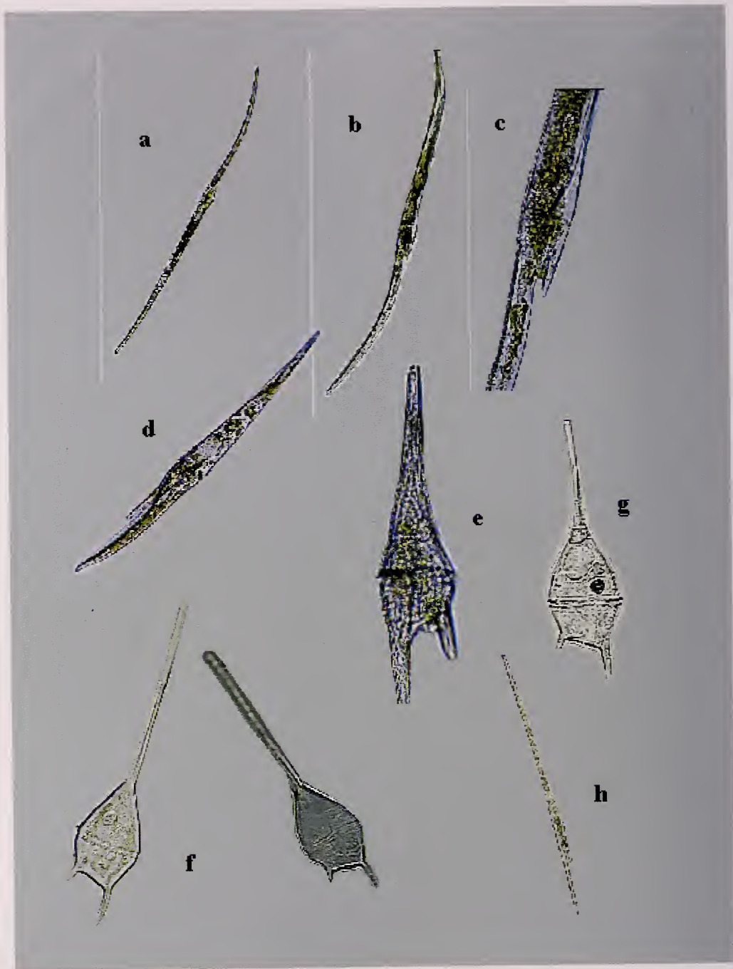
Lámina 2. a) Ceratium sp. aff. inflatum , 100X. b) Ceratium longirostrum , 100X. c) Ceratium longirostrum detalle de la teca, 400X. d) Ceratium incisum vista lateral, 200X. e) Ceratium furca vista ventral, 400X. f) Ceratium teres dos ejemplares, 400X. g) Ceratium lineatum vista dorsal, 400X. h) Ceratium belone , 100X.