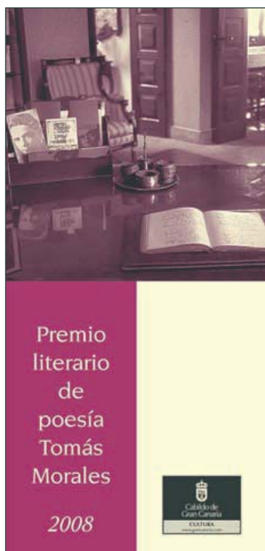
Bases del Premio de Poesía Tomás Morales, 2008