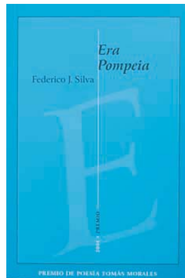
Cubierta del Premio de Poesía Tomás Morales, 2004 Casa-Museo Tomás Morales

La Casa-Museo, instalada en la casa natal del poeta Tomás Morales (1884-1921) permite al visitante adentrarse en el conocimiento de la figura humana y literaria del autor, a través del patrimonio documental y museográfico, con objetos personales, mobiliario, piezas de arte y testimonios documentales de su producción literaria, además de todo lo relacionado con la vida y obra del poeta del mar y la influencia que su entorno natal tuvo en ambas. La publicación de la revista que el lector tiene en sus manos añade otro elemento de consolidación. Con todo ello, la propia figura del autor de la Oda al Atlántico no ha dejado de crecer dentro y fuera de Canarias.