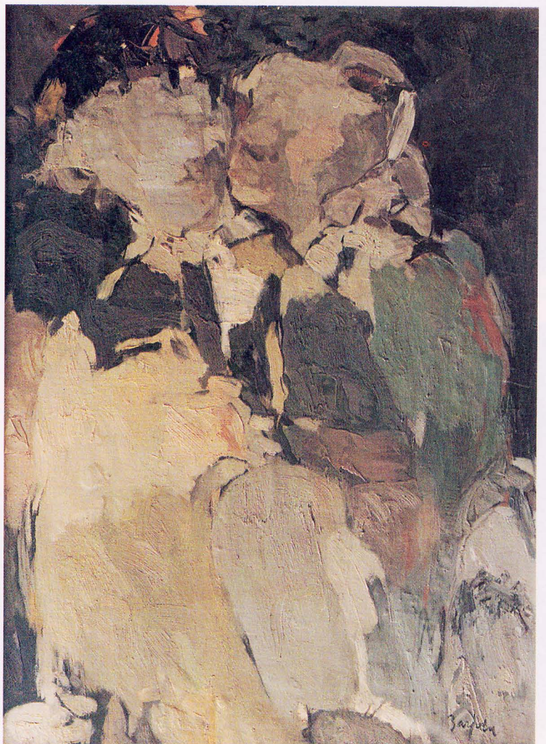
BARJOLA: El beso

A través de esta exposición que la Caja de Canarias presenta en el CICCA —como parte, seleccionada, de su patrimonio de obras artísticas—, podemos seguir un itinerario del arte en Canarias en nuestro siglo, encarnado en la producción de artistas de varias épocas, encuadrados en distintos movimientos y tendencias.