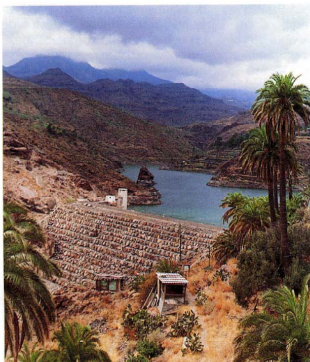
Presa de Tirajana