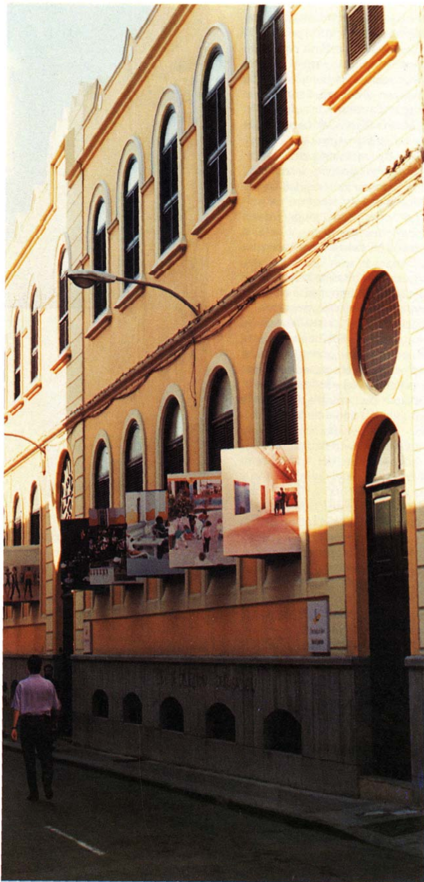
Centro Insular de Cultura