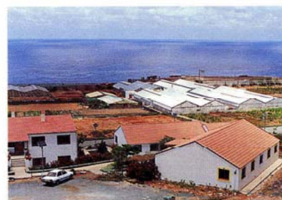
Granja del Cabildo

talleres—escuela, publicación de guías de productos, asistencia a congresos y la fundación de un Museo Etnográfico.