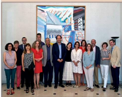
La Junta de Calificación, Valoración y Exportación de Bienes del Patrimonio Histórico. El organismo se renueva con carácter bianual, según lo dispuesto en la normativa vigente.