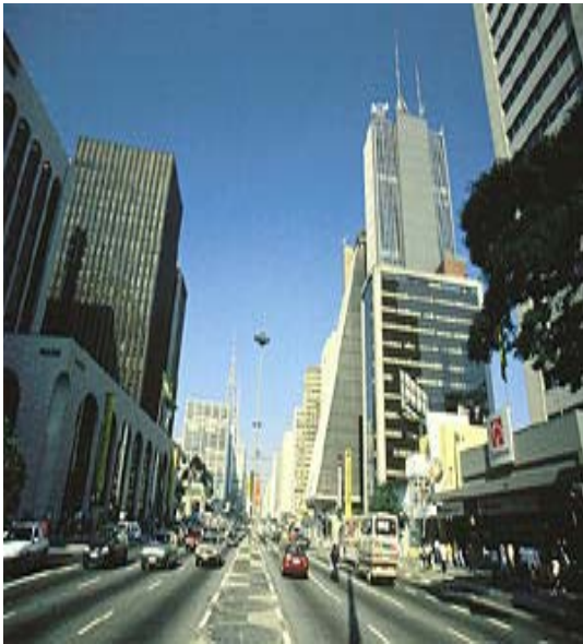
Foto 13. Avenida Paulista.

O centro expandido apresenta grande concentração de bens culturais, faz-se necessário um plano de ação que altere o congelamento das funções ali instituídas, interferindo no processo de reprodução da economia local, revitalizando-a e desenvolvendo um projeto de turismo que garanta a sustentabilidade do patrimônio cultural. A reabilitação do espaço urbano e a revitalização do patrimônio cultural são instrumentos importantes no fortalecimento das manifestações culturais em processo de descaracterização.