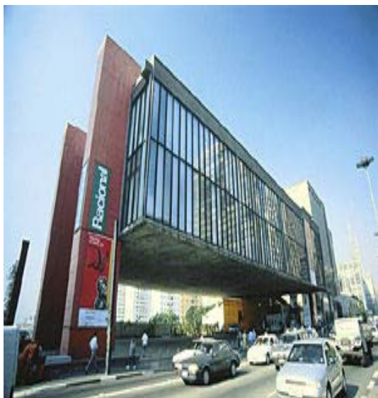
Foto 6. Museu de Arte de São Paulo. Fundado em 1947, o Masp funciona no edifício projetado por Lina Bo Bardi, possui uma variada coleção de obras além de acolher exposições itinerantes.

Inventariar o patrimônio cultural implica uma multiplicidade de classificação e agrupamento do bem, que deve ser