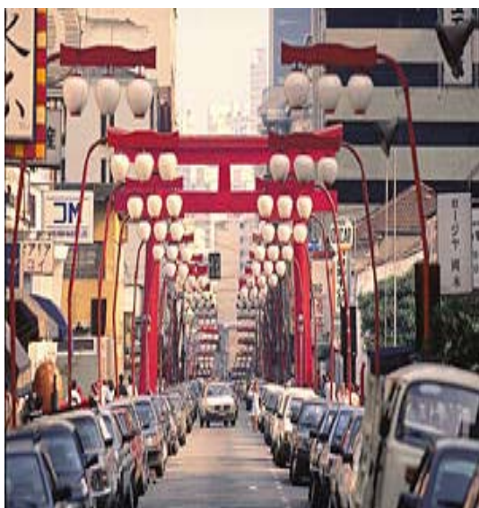
Foto 12. A Liberdade pode ser considerada um "pedacinho" do Japão em São Paulo. Parte das ruas está decorada com luminárias típicas e portais (torii) saudando os visitantes que buscam o bairro principalmente para saborear os pratos da culinária oriental.

A cidade possui monumentos consagrados e tradicionalmente veiculados na mídia: Parque Ibirapuera, Museu do Ipiranga, Borba Gato, Masp, Instituto Butantã e etc. Há que se observar, no entanto, que apesar da pesquisa ter sido realizada nas principais regiões nos quais eles se concentram, tais como área central, Ibirapuera, Paulista, Pinheiros, Itaim, Morumbi e Santo Amaro, nem todos foram identificados pelos entrevistados.