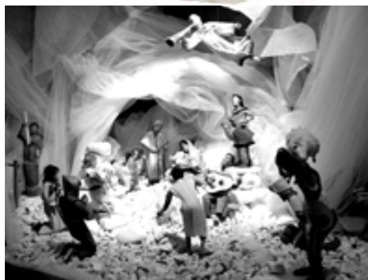
Fotos 7 y 8. Festas populares de caráter devocional.

Os bens foram catalogados mediante a realização de entrevistas com moradores/usuários de bairros pertencentes à área urbana do município. Foram realizadas cerca de 300 entrevistas nas regiões do Bexiga, Bom Retiro, Brás, Butantã, Brooklin, Campo Belo, Centro 15 ,