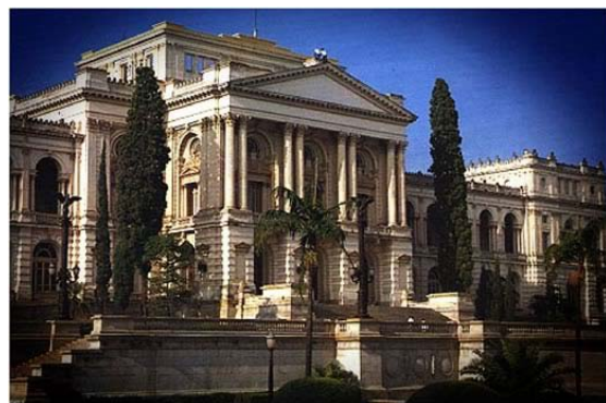
Foto 4. Museu Paulista. O monumento-edifício para celebrar a Independência foi projetado pelo engenheiro italiano Tommaso Gaudenzio Bezzi. Em estilo arquitetônico eclético, valorizou-se o modelo de palácio renascentista.

Ao ministrar a disciplina Turismo e Patrimônio Cultural no curso de Turismo da Universidade Anhembi Morumbi foi detectada a carência de informações, de forma rápida e segura, reunida em um único local, das áreas de interesse histórico e cultural da cidade de São Paulo. Objetivou-se reunir informações concisas sobre a natureza dos bens culturais, valor ambiental, histórico, instrumentos de proteção e características básicas, incluindo potencialidade turística, sinalização, acessibilidade, divulgação e demanda, num banco de dados.