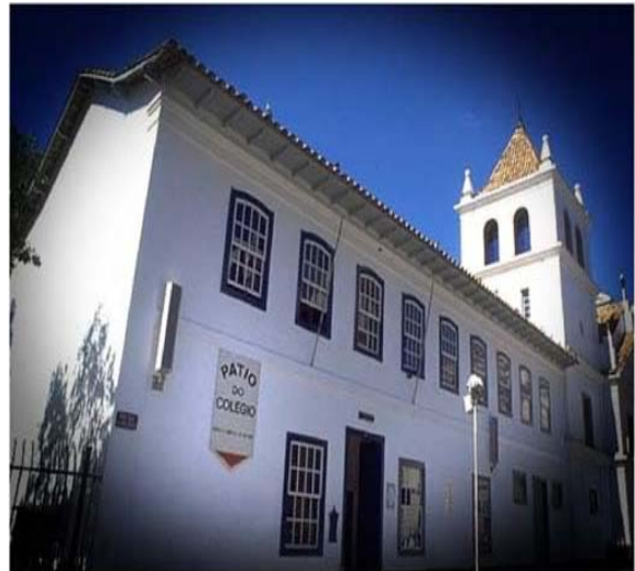
Foto 1. Pátio do Colégio: Logradouro de interesse histórico. Demolido em 1896 o edifício hoje existente é uma representação do antigo colégio e da igreja, objetivando resgatar elementos históricos da cidade. Em seu interior abriga um museu com objetos e documentos da cidade e da Companhia de Jesus.

Valoriza-se o patrimônio enquanto uma representação material da nação. Estilos arquitetônicos são revistos a fim de recuperar a arquitetura de caráter nacional, em nítida oposição ao estilo predominante: o ecletismo. Em meio a esse movimento, nosso patrimônio passa a ser carregado de simbolismo, materializando elementos da memória nacional. Instituições com funções nitidamente educacionais, tais como museus e monumentos históricos, são criadas por iniciativa do estado brasileiro. 6