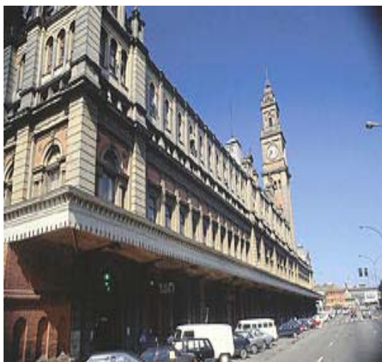
Foto 5. A Estação da Luz, inaugurada em 1º de maio de 1901, foi projetada em estilo vitoriano e todo o material utilizado na construção, trazido da Inglaterra.

estratégia decorre da necessidade de se ampliar a discussão sobre o caráter do patrimônio cultural, sempre restrito aos técnicos da preservação, arquitetos, historiadores, engenheiros e particulares afinados com a temática, ou de imposições políticas do governo brasileiro.