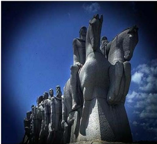
Foto 3. Obra de Arte: Monumento às Bandeiras. Obra do escultor modernista Victor Brecheret, o Monumento às Bandeiras, com 60 metros de comprimento, foi esculpido inteiramente em granito.

O patrimônio cultural é entendido como um amplo e diversificado conjunto de bens culturais que permite a cada segmento social apropriar-se do passado, compondo imagens de sua identidade, quer individual ou coletiva. 14 Destituído de critério único, objetivo e universal, o conceito engloba bens culturais não-consagrados, expressões e fazeres das classes populares, bem como a identificação de elementos coletivamente importantes em nossa sociedade, além do tradicional patrimônio histórico e artístico. Busca-se a valorização da cultura, da memória, da educação e da história.