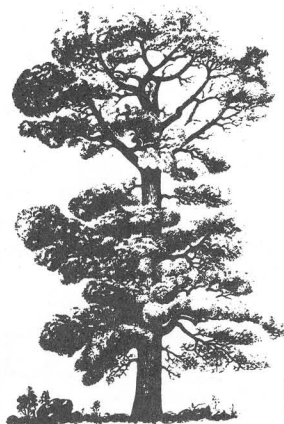
PINO CANARIO ( Pinus canariensis )