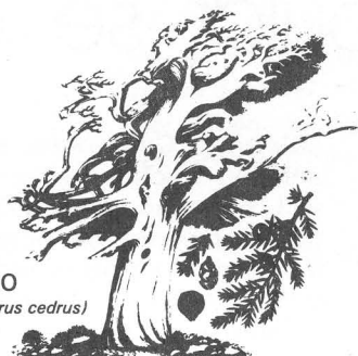
CEDRO ( Juniperus cedrus )