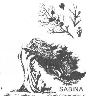
SABINA ( Juniperus phoenicea )

INSTITUTO NACIONAL PARA LA CONSERVACION DE LA NATURALEZA - ICONA