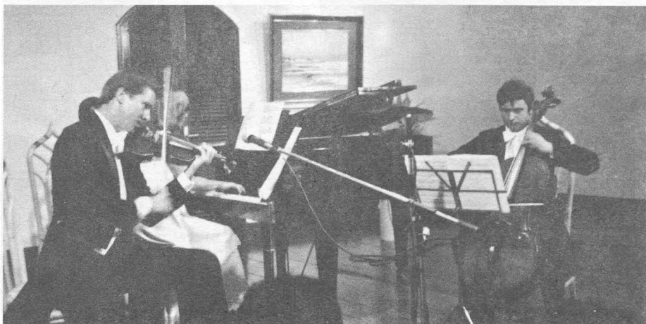
Recital de música impresionista