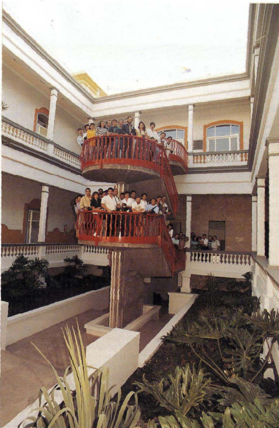
Participantes en las Jornadas Fotográficas «Un día en Las Palmas de Gran Canaria». 27 - 6 - 92

Los talleres de música, literatura y debates, cine, vídeo, fotografía, teatro, danza y escenografía se desarrollan en este edificio