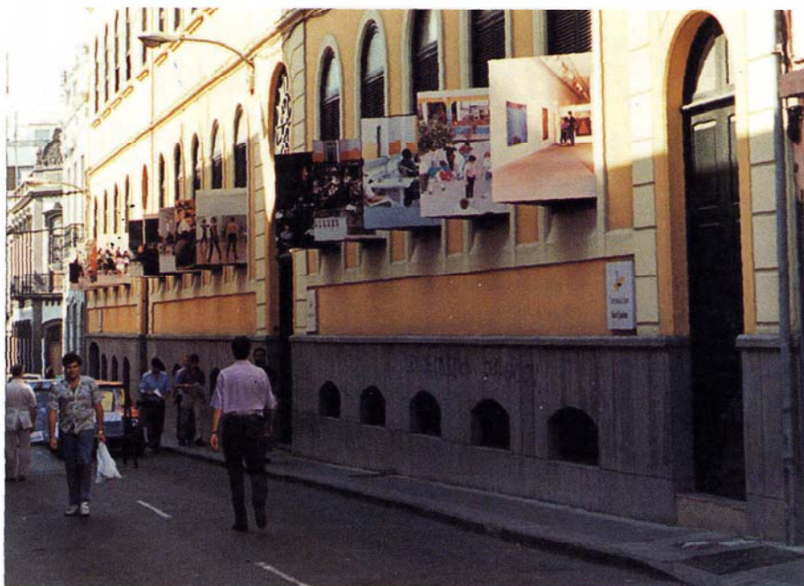
El CIC alberga gran parte de las áreas creativas del Servicio Insular de Cultura del Cabildo

En este sentido el taller de Cine para el próximo año pretende continuar con su labor formativa a través de cursos impartidos por profesionales de reconocido prestigio,