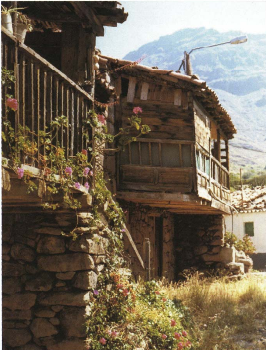
Las casas tradicionales de Veneguera serán rehabilitadas

Por otra parte, la Consejería de Política Territorial se propone este año nuevos viveros en Bandama, Tirma y Cortijo de Huertas. ●