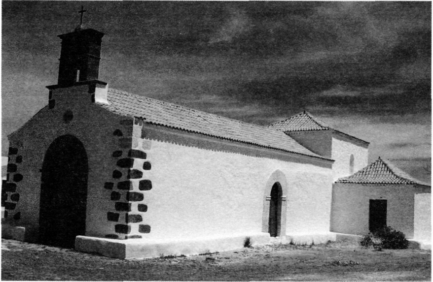
Ermita de Nuestra Señora de las Mercedes (El Time), edificada a principios del siglo XVII