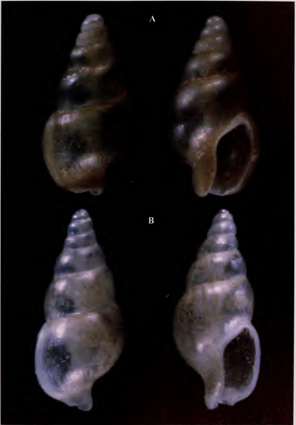
Lámina 1.- A. Holotipo de Astyris rolani nueva especie; B. Holotipo de Astyris angeli especie nueva.