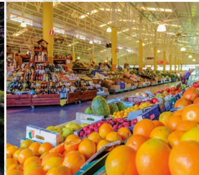
Mercado de San Mateo.