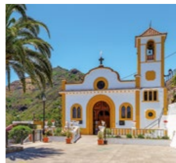
Iglesia de Santa Mónica en Utiaca.

Desde San Mateo nace el Barranco de la Mina para atravesar la Isla hacia el noreste y desembocar en la capital grancanaria, actualmente la desembocadura se encuentra tapada/oculta por una autopista/tramo viario que hizo desaparecer también los