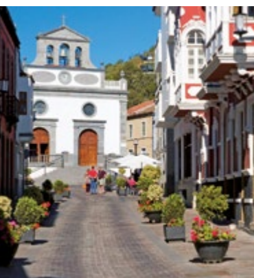
Iglesia de San Mateo.

La Vega de San Mateo tiene una situación privilegiada, a tan sólo 21 kilómetros de la capital, Las Palmas de Gran Canaria y estratégicamente situado en el centro de la isla de Gran Canaria.