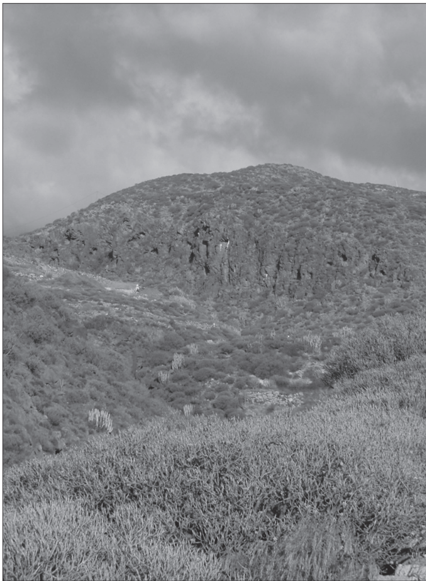
FOTO 7: Emplazamiento de la Morra de Tónete o Tente (Arico) desde el Barranco de las Revueltas.