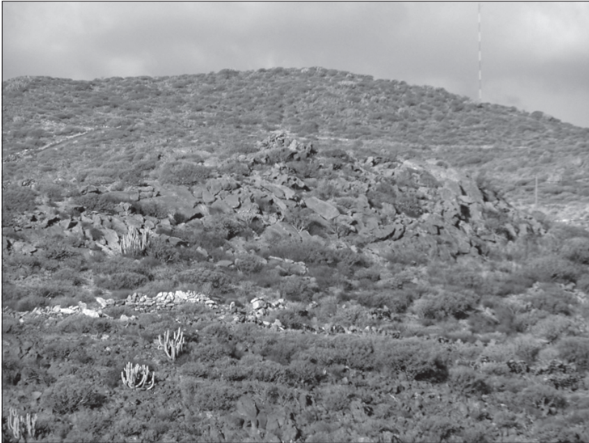
FOTO 1: Emplazamiento del Tagoro del Barranco de las Revueltas IV (Arico).

inferior de la margen izquierda del barranco de las Revueltas, muy próxima a un salto de agua del barranco con un eres donde se acumula el agua de lluvia o permanece más tiempo el agua arrastrada por el barranco.