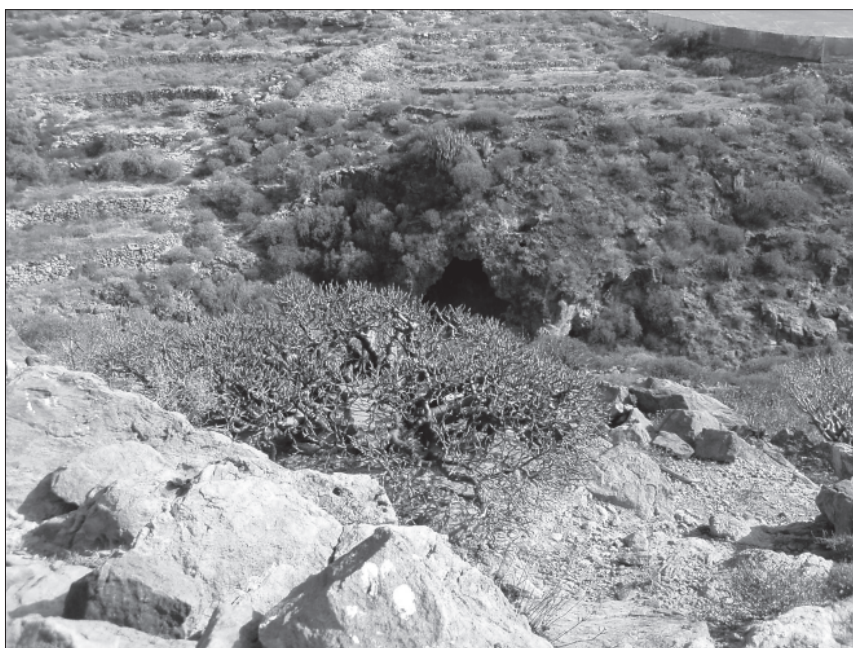
FOTO 2: Vista de la cueva de habitación del Barranco de las Revueltas VI (Arico) desde el Tagoro.

ca reciente para el estabulado de ganado caprino, que oculta los restos arqueológicos, muy fragmentados. UTM: X: 355.923. Y: 3.113.898 (fotos. 2-3).