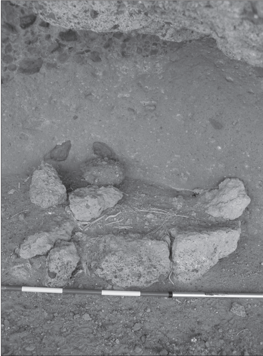
FOTO 10: Hogar en el abrigo natural en tosca del Barranco de las Lisas o de Las Moriscas II (Arico).