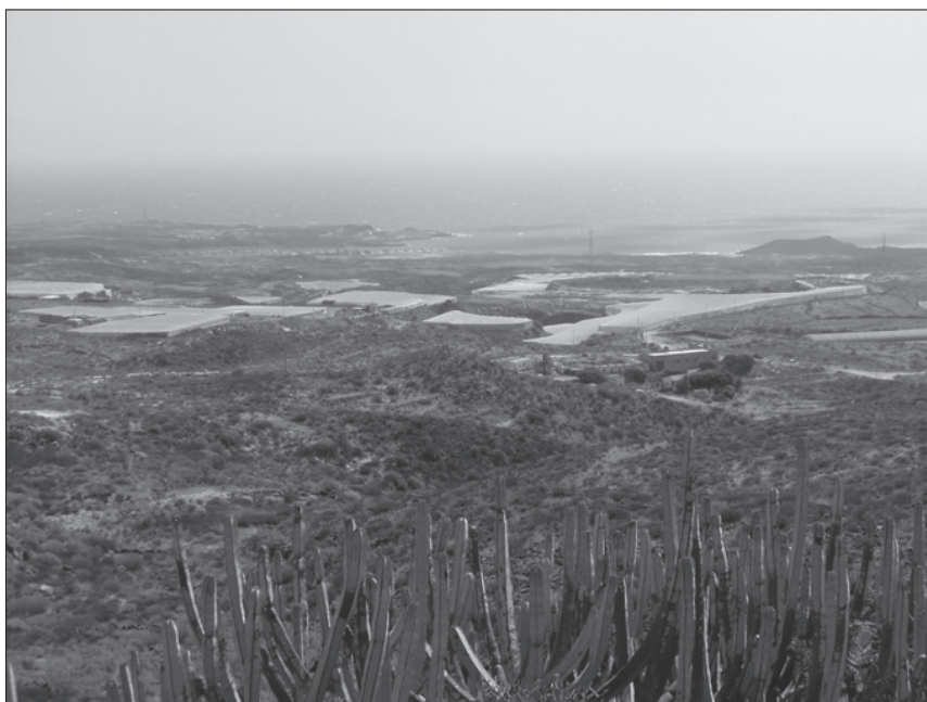
FOTO 9: Ensenada de Abades desde la atalaya situada en la Loma del Llano de San Juan I (Arico).

El yacimiento se sitúa en la parte más elevada de la loma, con una gran cantidad de material arqueológico en una superficie de ca. 16 m. x 10 m., próximo a un muro reciente, límite del abancalamiento, que conserva unas medidas de 10 m. de longitud, 0.60 m. de grosor y dos hiladas de piedras superpuestas con 0.45 m. de altura máxima, con dirección SE. En super-