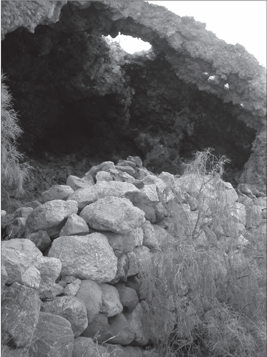
FOTO 3: Gran cueva de habitación del Barranco de las Revueltas VI (Arico).