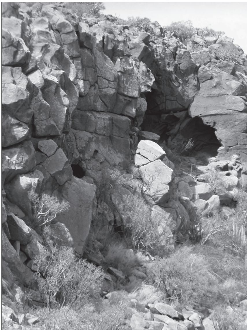
FOTO 4: Emplazamiento de la necrópolis del Barranco de las Revueltas (Arico).