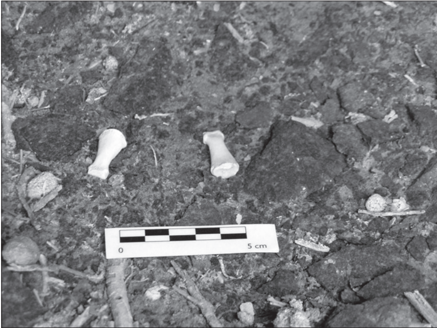
FOTO 6: Falanges humanas en la cueva funeraria del Barranco de las Revueltas VII (Arico).

medidas de 0.66 m. de longitud en la entrada x 1.15 m. de profundidad x 0.75 m. de altura, con una orientación de 115° E., en la que todavía se localizan algún resto humano muy fragmentado. UTM: X: 355.598. Y: 3.114.104.