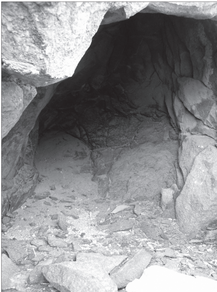
FOTO 5: Cueva funeraria del Barranco de las Revueltas VII (Arico).