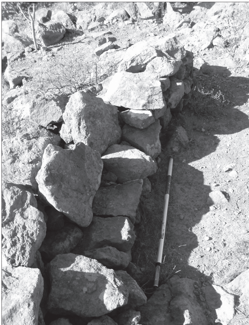
FOTO 13: Bancos conservados del Tagoro de la Morra de Tónete o Tente (Arico).