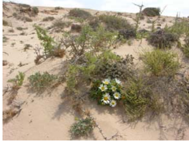
Figura 4.- Ejemplar de A. schultzii que al estar al abrigo de caméfitos alcanzan mayor porte