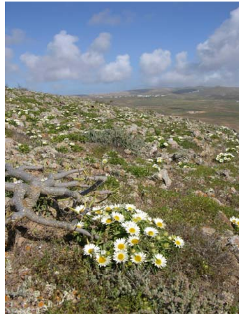
Figura 2.- Asteriscus schultzii en un tabaibal abierto de Euphorbia regis-jubae .