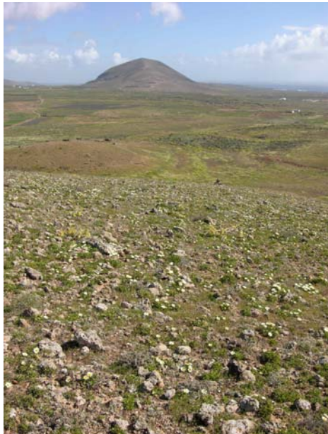
Figura 1.- Ladera con gran densidad de ejemplares, al fondo la montaña de Tinamala cerca de Guatiza

En esta zona costera del Parque Nacional de Timanfaya fue observado un solo individuo (sin flores) en un tabaibal dulce halófilo con Suaeda ifniensis Cab. y Salsola divaricata Mass. ex Link. in Buch, posiblemente un ejemplar joven recientemente reclutado.