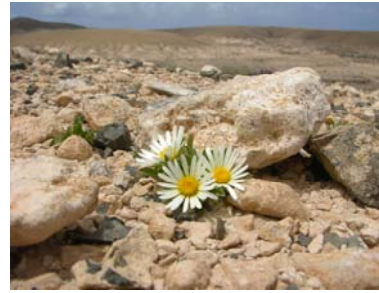
Figura 5.- En terrenos pedregosos y desprovistos casi de otra vegetación, A. schultzii reduce su parte vegetativa considerablemente.

Dentro de la cuenca de Lajares, A. schultzii está presente en las siguientes localidades (Figura 6):