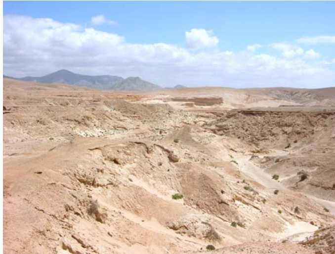
Figura 3.- Paisaje en la cuenca de Lajares con sedimentos arenosos antiguos, hábitat del A. schultzii .

desarrollan en lugares más llanos con suelo arenoso, formando con frecuencia microdunas, donde convive con Frankenia capitata Webb & Berthel., Polycarpaea nivea , Lotus lancerottensis , Heliotropium bacciferum Forssk., Launaea nudicaulis (L.) Hook. fil., Launaea arborescens , Ononis hesperia (Maire) Förther & Podlech y en ocasiones Androcymbium psammophilum Svent. (Figura 3). En pequeños barrancos, donde la humedad es mayor, se unen con frecuencia ejemplares poco desarrollados de Euphorbia regis-jubae .