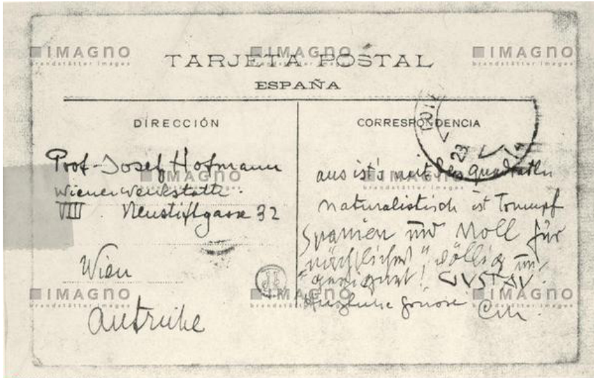
IMAGNO Handwritten postcard from Carl Moll and Gustav Klimt to Josef Hoffmann. Sent from Toledo, Spain, 1909.