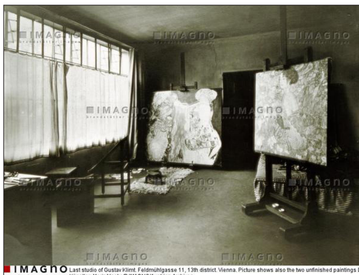
Último estudio con obras inacabadas de Gustav Klimt en Feldmühlgasse n. 11, distrito 13 en Viena. año 1918.