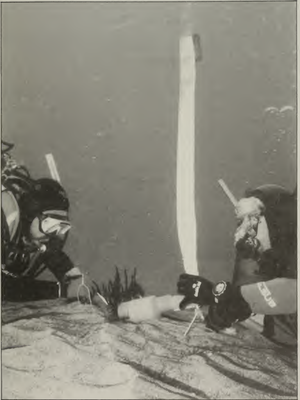
Extracción de fauna asociada