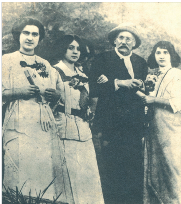
La vejez de Don Benito , 1914.

Muy elocuentes son las referencias del afecto que siempre demostró para su tierra de nacimiento y de sus primeras alboradas a la vida y su madura razón.