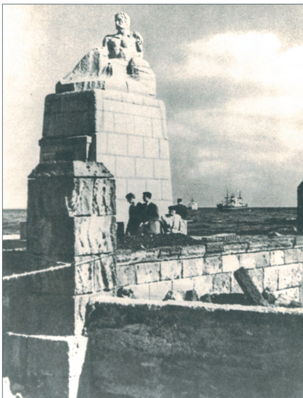
Monumento a Galdós por Victorio Macho. Muelle de San Telmo, 1945-1950.

medido número de artículos de opiniones de toda índole. Este asunto tendrá una larga duración en el tiempo de más de 10 años, que por diversas causas no se pudo instalar, hasta que fuera inaugurada el 28 de septiembre 1930.