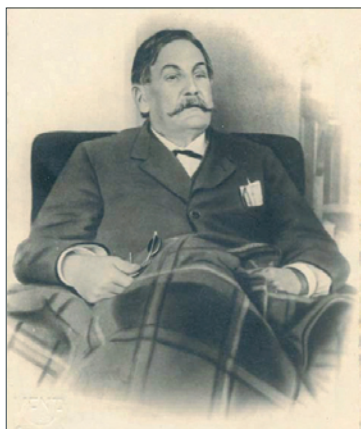
Benito Pérez Galdós, 1915.

te obra por él creada. Hay que hacer constar que Galdós nace y vive en Canarias hasta los diecinueve años, por lo que su formación de joven, su sentir y despertar a la vida como persona, su cultura y tradicionales usanzas están vinculados íntegramente a Gran Canaria. La otra formación humanista y de nuevos ambientes, la de escritor vocacional fue modelada en Madrid.