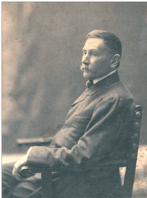
Benito Pérez Galdós

Y en su Memorias de un desmemoriado , deja una siembra de su fecunda remembranza, que constituyen una prueba más de su cariño a la tierra que le dio vida y en la que despertó la razón y su prodigiosa imaginación novelesca en su adolescencia, con los artículos juveniles denominados Mi criado Bartolo y Yo , (de influencia cervantina), publicados en