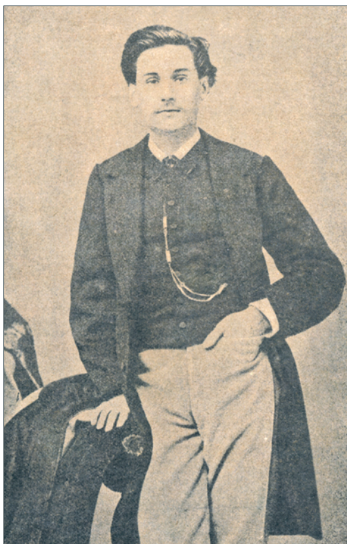
Benito Pérez Galdós, 1890-1900.

y otras vividas in situ y ante sus ojos—. De no haber vivido en Madrid, por su privilegiado genio literario, no hubiese sido uno de los escritores más brillantes de su época, que a pesar de su talentosa pluma, su obra no hubiese alcanzado la trascendencia de rango universal. De haber vivido su madurez y escrito en Las Palmas, solo se hubiera quedado en un escritor local, regional a lo sumo, influido por el ambiente isleño, regionalista y costumbrista de las islas. Aunque hayan quienes se aventuran a promulgar que renunció a Canarias, porque las islas y su historia no figuran en sus obras. Su sabia decisión, hizo prevalecer la importancia nacional y universal de su obra, sobre los añorados apegos del terruño. En los últimos días de la existencia de don Benito, fue un agónico recapitular todo el sentimiento patrio de su niñez, recordando hechos y anécdotas de su primitiva vida en Las Palmas.