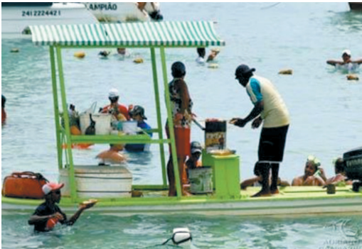
Figura 4. Comercialização de alimentos e bebidas (23/01/2009)