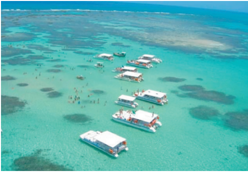
Figura 2. Exploração turística das Galés de Maragogi