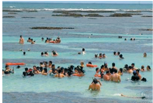
Figura 5. Aglomerado de pessoas nas Galés (23/01/2009)