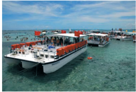
Figura 3. Excesso de catamarãs ancoradas sobre os recifes