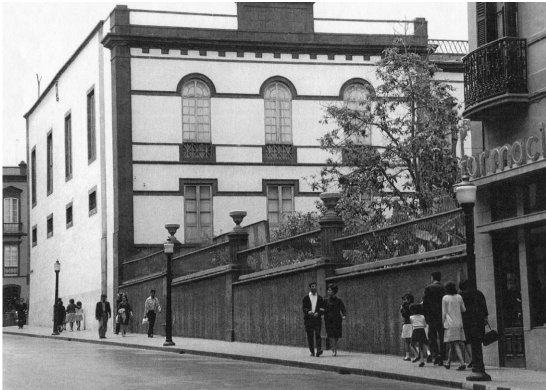
2.- Muro de cerramiento del jardín del palacio episcopal, calle Obispo Codina, antes de la reutilización del coro. Archivo del Museo Canario. Caja 50. Legajo 2.