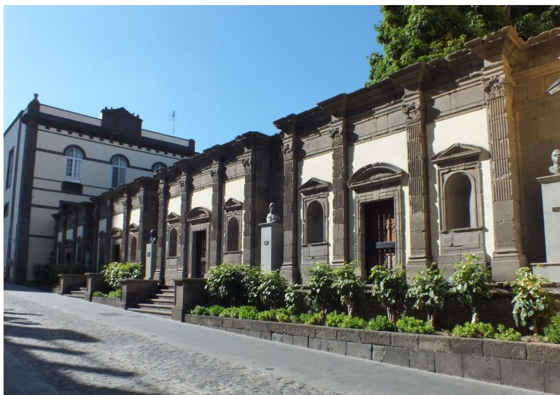
4.- Visión actual del coro en la calle Obispo Codina.