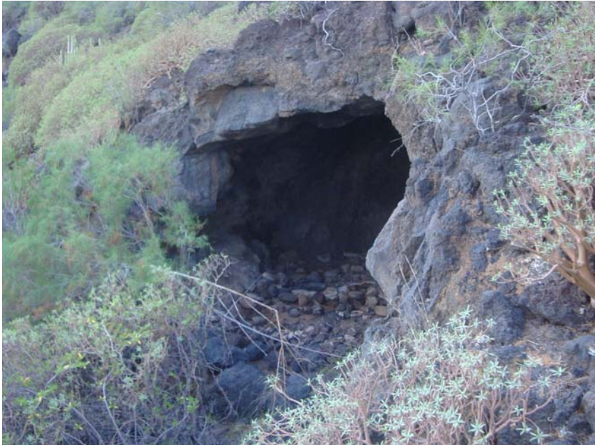
Foto 3. Cueva de habitación de Barranco de Cueva Negra IV, la más importante del entorno.

la zona central del acceso con una zona rehundida, de un posible hogar, de 0,50 x 0,45 m. Lo más interesante es la presencia al interior, en su extremo noroeste, de una estructura de piedra, a modo de cama, de 1,90 m de largo por 1,10 m de ancho y 0,45 m de alto, bien conservada, que no puede tratarse de un banco porque el nivel de piedras de la base está muy bajo. En superficie se localizó cerámica aborígen, cerámica a mano de engobe rojo y malacofauna de Patella sp. , Thais haemastoma y Osilinus atratus . Figura en el Inventario Arqueológico del Valle de Güímar como Playa de Arriba I. UTM: X: 364117. Y: 3129827 (Fotos 3 y 4).