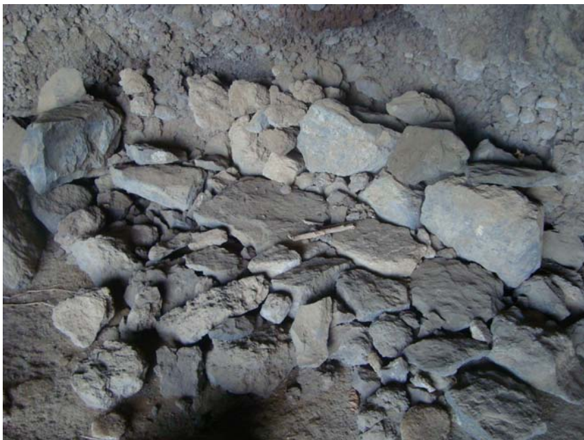
Foto 4. Estructura de piedra a modo de cama en el interior de la cueva de habitación de Barranco de Cueva Negra IV.

estabular ganado, que actualmente se encuentra oculto por la vegetación y sólo es visible cuando se está junto a ella. Cuenta con unas dimensiones de 2,20 m de longitud en la entrada, 1,80 m de profundidad y una altura máxima de 1,40 m, con una orientación de 115° E. Presenta una pared de cerramiento de parte de la entrada, con unas dimensiones de 1,40 m de largo, 0,70 m de ancho y 1,20 m de alto, conservando 4 hiladas de piedras superpuestas. En superficie sólo pudo localizarse malacofauna de Patella sp. cercana a la entrada, por lo que no puede asegurarse un cronología aborigen. Tanto esta cueva como la siguiente están ocultas por un muro reciente de piedra seca de más de 1,50 m de altura que rodea ambas cuevas creando un espacio cerrado al interior. UTM: X: 364102. Y: 3129898.