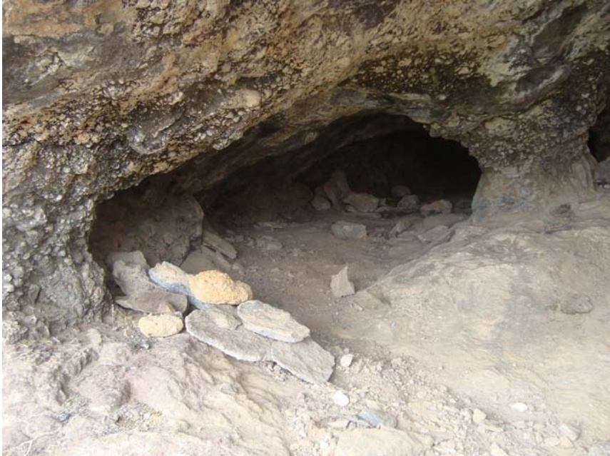
Foto 5. Cueva funeraria de Barranco de Afoche-El Pozo III, con muro de cierre en el acceso a un tubo volcánico con enterramientos.

ca en la Playa de los Tarajales, se encuentran tres pequeñas cuevas. La que cuenta con mejores condiciones no presenta materiales arqueológicos en su interior, aunque el sedimento ha sido removido por perros y cabras escarbando. A un 1 m de dirección norte, ascendiendo unos 2 m, hay otras dos pequeñas covachas, de 1,20 m de longitud al norte y 1,30 m al este, 1,98 m de profundidad y 0,95 m de altura, orientada a 50° N, en cuyo exterior se ha preparado una pequeña plataforma con piedras para crear una superficie más horizontal. En su interior, y en particular al exterior de la boca, cayendo por la ladera hacia la primera cueva más grande, se observaron la presencia de obsidiana, una posible lasca de basalto, fauna de ovicápridos, malacofauna de Patella sp. y cerámica histórica a mano. UTM: X: 364088. Y: 3129693.