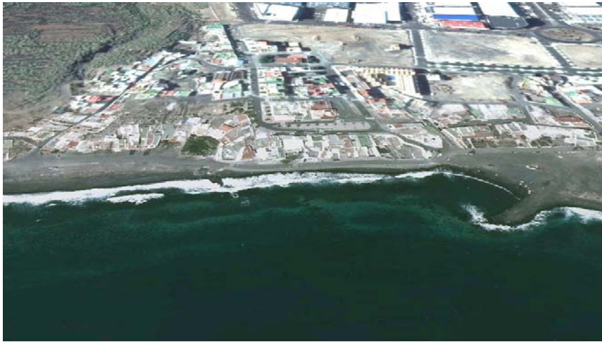
Foto 10. Playa del Socorro o de la Entrada, con desembocadura del Barranco de Chinguaro.

el «Pozo viejo» 43 , el cual está excavado hasta unos 10 metros de profundidad y cuenta con una escalera de piedra que permite descender para acceder al nacimiento de agua 44 . La existencia de un punto de aguada en la costa debió convertir a esta playa en un referente habitual para los marinos (Fotos 10 y 11).