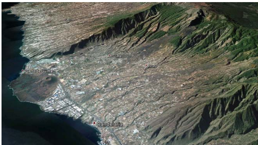
Foto 8. Propuesta de límite occidental del Menceyato de Güímar en la Ladera de Güímar y Barranco de Badajoz.

tratar de independizarse como municipio en época histórica, primero en 1858 y después durante la Segunda República 14 . En este sentido, ya era un territorio específico como recoge una data de 1505, «Diego de Badajós. Una huente de agua q.[ue] es entre Agache e Imobade y Abona; q.[ue] es término desta isla con toda la t[ierr]a. q.[ue] pudiere aprovechar en q.[ue] pongáis una viña» 15 . Este dominio daba a Taoro el control de importantes zonas de pasto para las cabras como era El Escobonal, en el extremo occidental del actual municipio de Güímar.