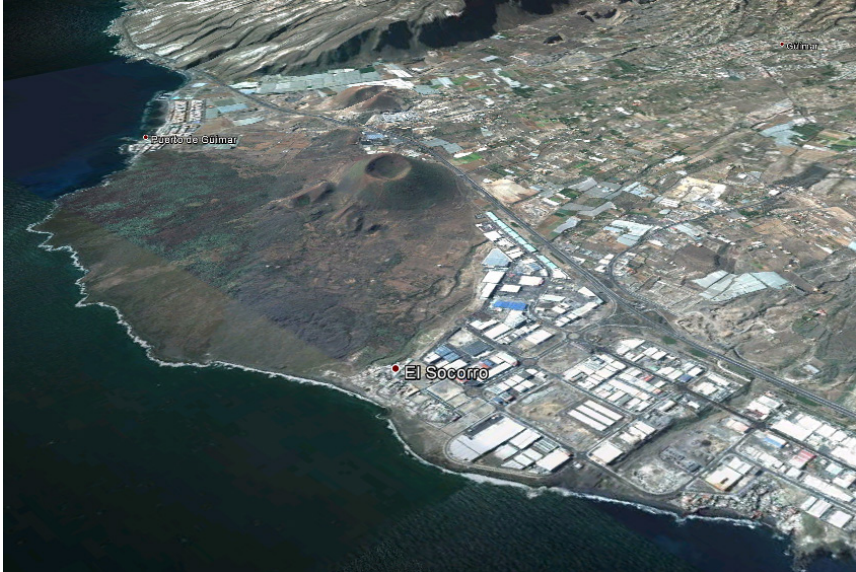
Foto 9. Malpaís de Güímar, espacio fronterizo de transición junto a la Ladera de Güímar reservado para pastos entre el Malpaís de Güímar y el territorio de Imobad, controlado por el Menceyato de Taoro, en cuyo límite oriental se encuentra la Playa del Socorro.

Güímar, con la Playa de la Entrada o del Socorro y la desembocadura del Barranco de Chinguaro (Foto 9).