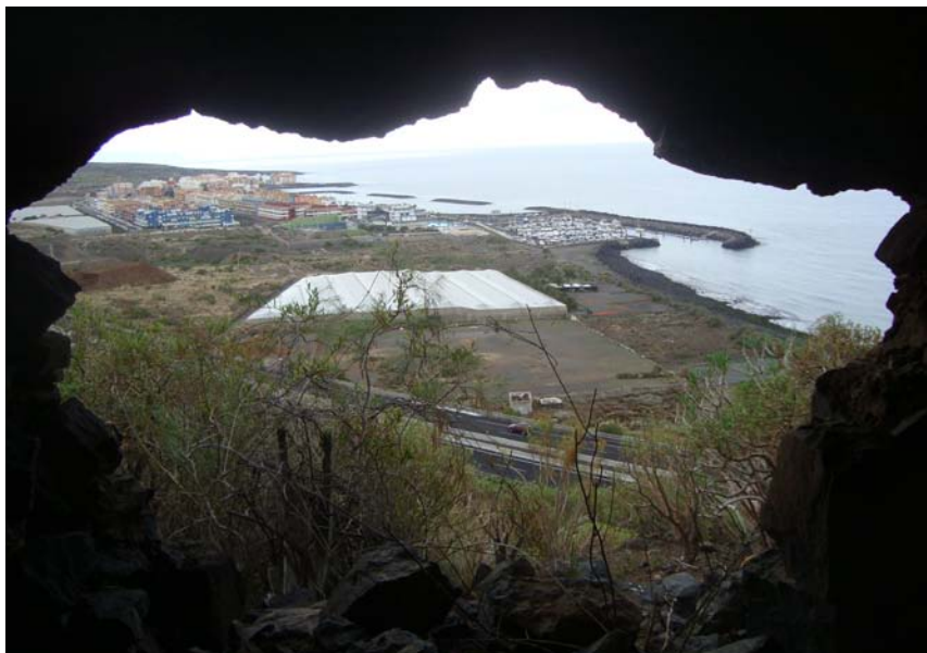
Foto 2. Cueva de habitación de Barranco de Cueva Negra III, controlando la desembocadura del Barranco de Badajoz y el actual puertito de Güímar.