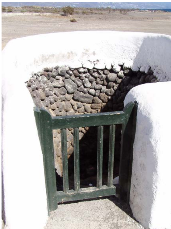
Foto 11. Pozo Viejo en 1534 de la Playa de Playa del Socorro o de la Entrada.

Y los dichos Pedro de Ervas e Ibone de Armas dijeron, que ha veinte años, poco más o menos, que saben y vieron traer la dicha cera a muchas personas [...] que, a las veces, parecía de diez o doce libras, y otras veces quince y veinte libras. Y que saben que este presente año pareció cantidad de veinte libras y más» 45 .