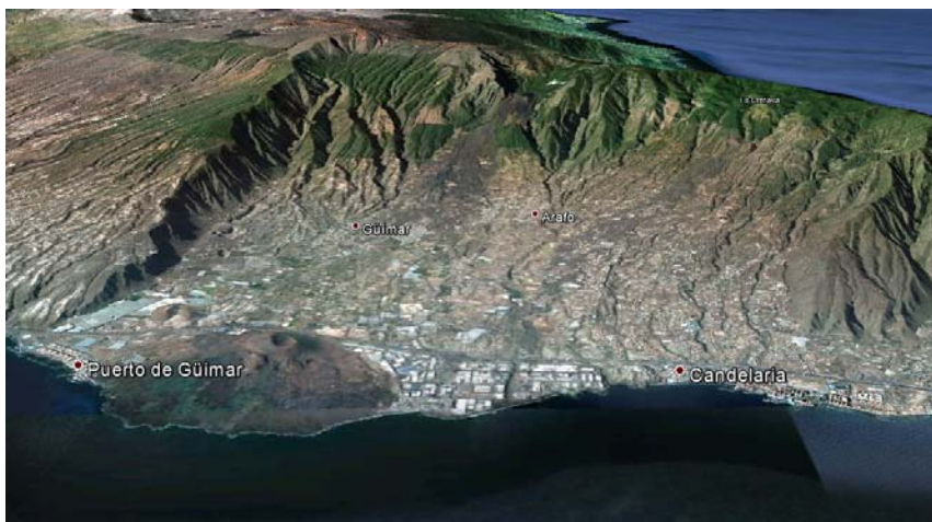
Foto 1. Valle de Güímar.