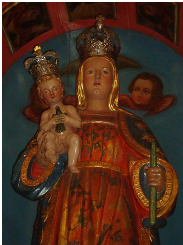
Foto 12. Imagen de la Virgen de la Candelaria en la Iglesia de Santa Úrsula de Adeje, cuyos bordes de las mangas y cinturón presentan escritura.

do, un siglo después, resulta ser el canónigo Viera y Clavijo 142 cuando se pregunta «¿Perdería acaso su estimación por haber sido la imagen obra excelente de un escultor humano o porque la hubiesen desembarcado en las riberas de Tenerife algunos cristianos piadosos?».