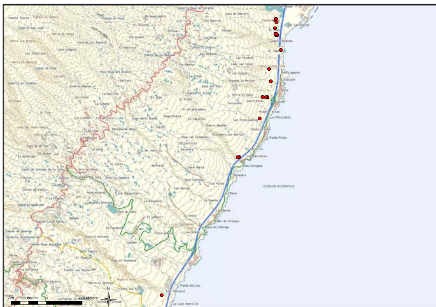
Figura 1. Distribución de yacimientos en el litoral entre la desembocadura del Barranco de Badajoz y la comarca de Agache (Güímar, Tenerife).

Güímar y Fasnia, bien por el Barranco de El Río, límite actual entre Arico y Granadilla.