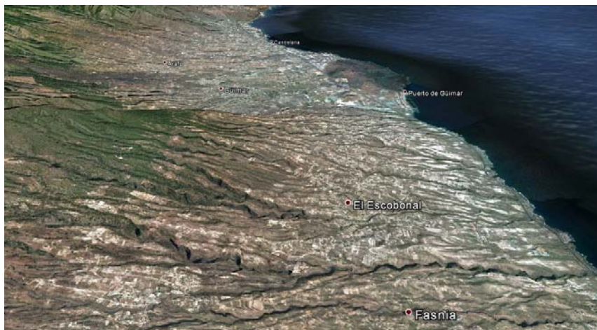
Foto 6. Límite occidental del Menceyato de Güímar situado en el Barranco de Herques que separa Fasnia de El Escobonal según Béthencourt Alfonso (1912) y Diego Cuscoy (1968).

se dice la t[ierr]a. de Ymovard y llámase el agua Cebeque y el agua se llama Tamaduçe, las cuales d[ic]has. t[ierr]as. son en derecho de los Abrigos» 5 .