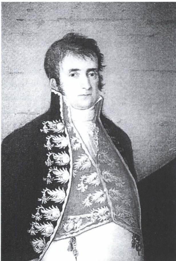
Burócrata Español. Luis de la Cruz. Museo Lázaro Galdiano (Antonio Rumeu de Armas. Luis de la Cruz Rios. Canarias 1997)

Pero en el siglo XVIII hubo un cambio importante y favorable de la visión inglesa de España como resultado de la visita de una serie de viajeros modestos que publicaron libros sobre sus viajes, cuando los libros de viajes eran muy influyentes en la formación de las visiones de los