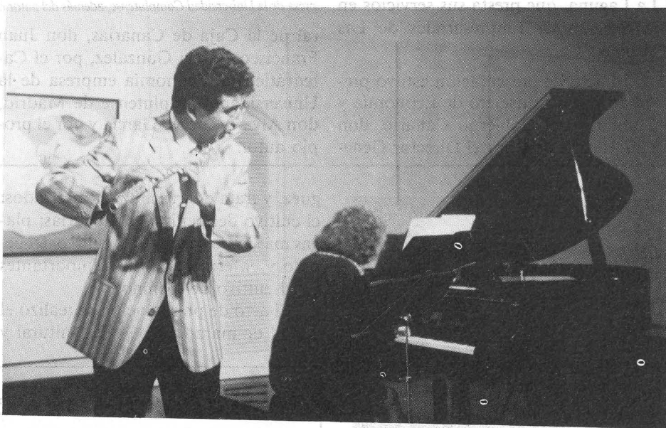
Recitales y manifestaciones musicales en nuestra programación artística.

seo de Néstor, que acude por primera vez a este recinto.