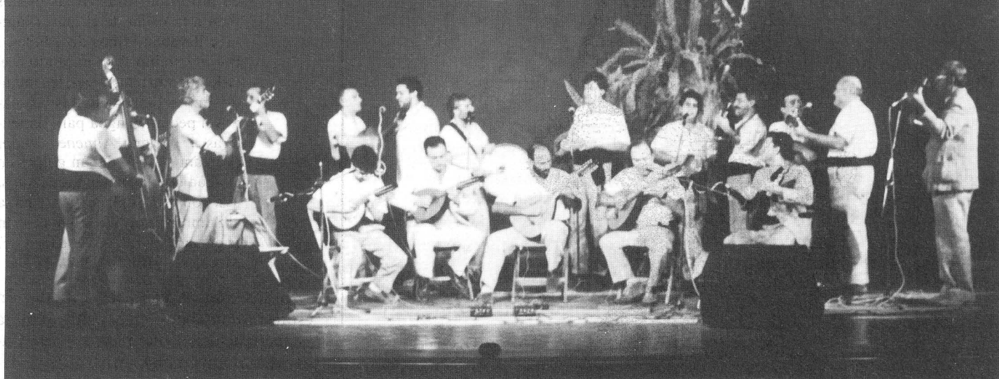
Folklore canario en nuestras semanas artísticas.

S iguendo con la iniciativa de llevar la figura del pintor Néstor Martín Fernández de la Torre por todos los rincones de su isla natal, una exposición didáctica sobre el mismo y la circunstancia de su personal estilo pictórico, de indiscutible aportación al Modernismo, ha sido exhibida en el Centro Cultural Antígafo de Agaete, en el Ateneo Municipal de Vecindario, en el Salón de Actos del Ayuntamiento de Agüimes y en la Casa de la Cultura de Telde.