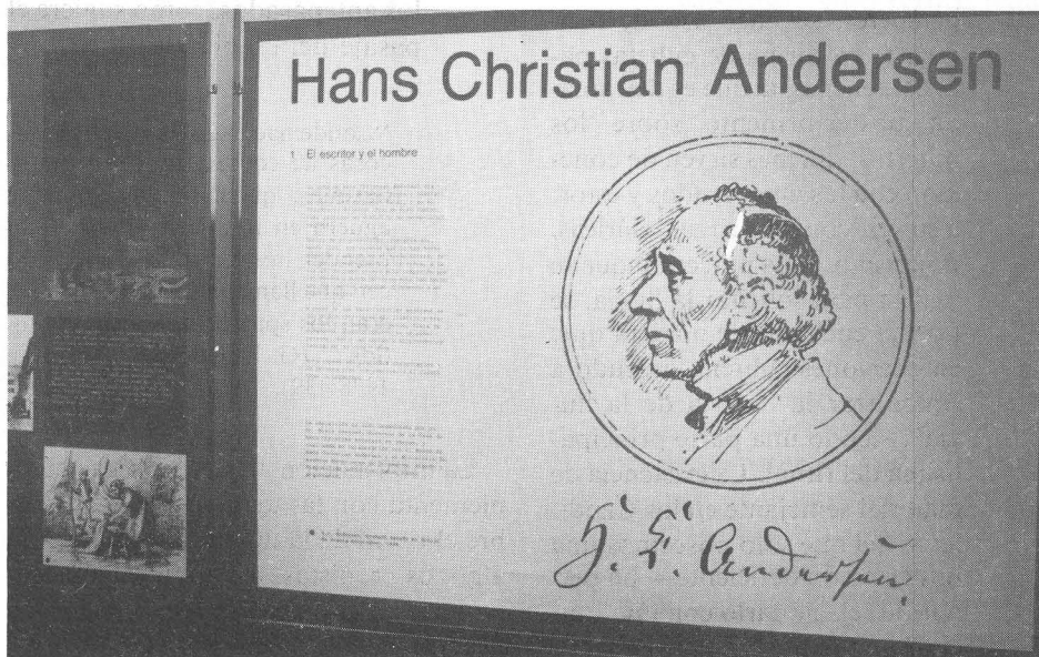
Exposición didáctica itinerante sobre Hans Christian Andersen.

Ha presentado el número 81 de la Revista de Occidente, dedicado a “La Arqueología hoy” y que ha sido patrocinada por nuestra Caja Insular de Ahorros de Canarias, la Caja General de Ahorros de Canarias y Unión Eléctrica de Canarias. En esta presentación se pudo contar con el Vicepresidente primero de la Caja