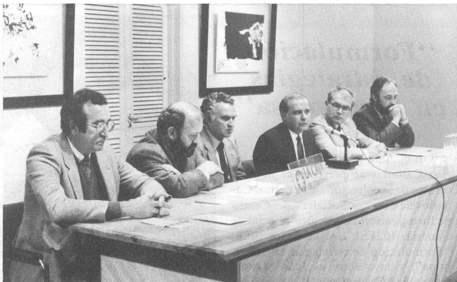
Presentación en el Aula Cultural del número de "Revista de Occidente", dedicado a la arqueología.

En Arco 88 se presentan varias galerías de arte de las islas, así como el Mu-