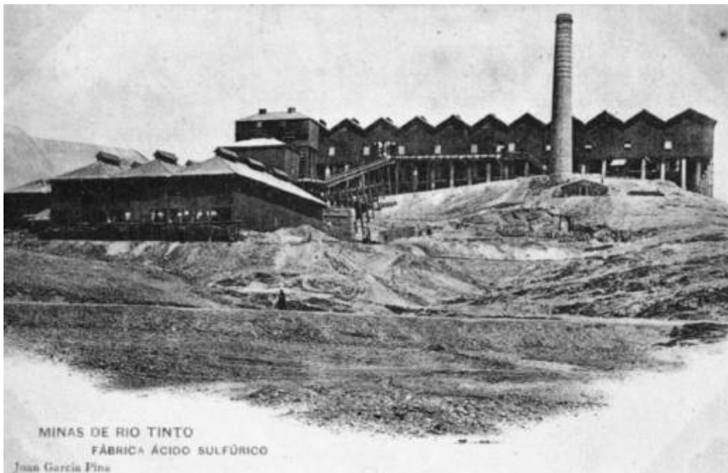
Foto 9. Antigua fábrica de ácido sulfúrico (Postal de la época, C.P.)

primitiva, edificio que fue abandonado después de la construcción de la nueva fábrica de ácido de Riotinto en 1960.