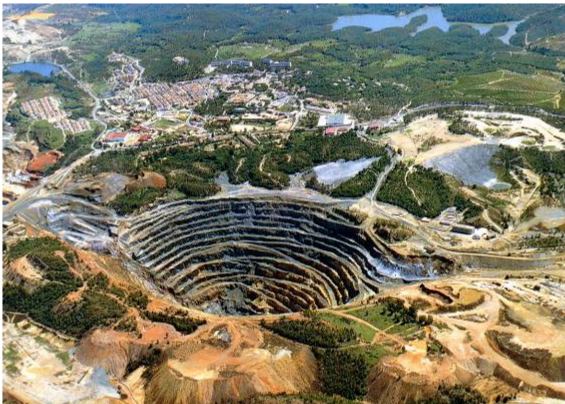
Foto 10. Panorámica de Corta Atalaya y el pueblo de Riotinto al fondo