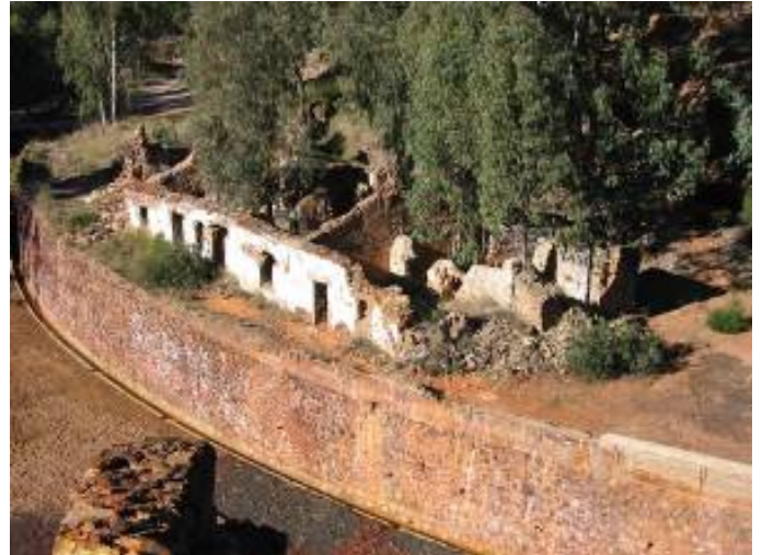
Fotos 20 y 21. Poblado minero "Grupo Pilonos" en Peña del Hierro (antes y después de su restauración) (E. Romero)

Otro de los proyectos que se han llevado a cabo ha sido la reconstrucción del malacate de Peña del Hierro, financiado por la Mancomunidad Minera y ADR y ejecutada por la Fundación Río Tinto, dentro de un