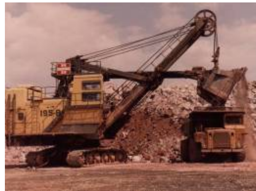
Foto 12. Excavadora década de los 80

cen la Corta Atalaya y Pozo Alfredo, se localiza en el flanco sur del anticlinal de Riotinto, asociado a un pliegue menor (sinclinal) de dicho flanco. En este yacimiento concurren un "Stockwork" y un lentejón de sulfuros masivos situado sobre él. El Stockwork afecta a la roca del muro de los sulfuros masivos, que son fundamentalmente volcánicas ácidas altamente cloritizadas, lo que les confiere un color verdoso. Pues bien, la masa de sulfuros masivos se explotaba a cielo abierto mediante la Corta Atalaya y el Stockwork a través de Pozo Alfredo (minería subterránea).