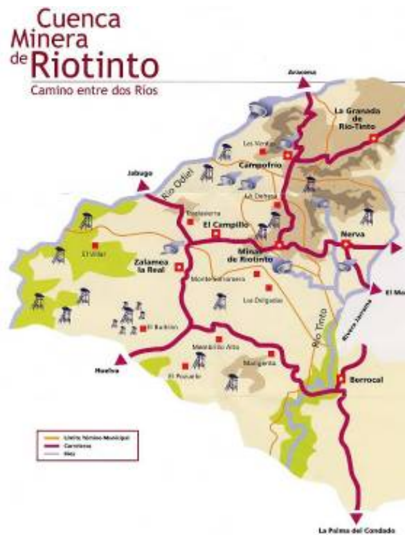
Cuenca minera de Riotinto

Berrocal, El Campillo, Campofrío, La Granada de Riotinto, Minas de Riotinto, Nerva y Zalamea la Real, entre los que se distribuyen sus aproximadamente 20.000 habitantes. A estos 7 municipios pertenecen también 7 pedanías: El Villar, El Pozuelo, El Buitrón, Las Delgadas, Monte Sorromero, Membrillo, Ventas de Arriba y Marigenta.