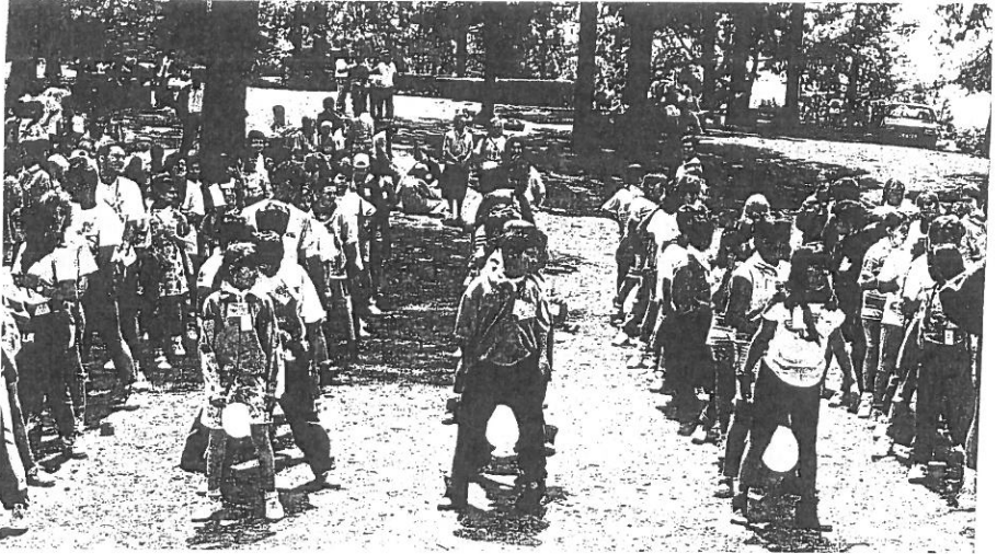
Encuentro de niños y niñas de Síntesis de Fe en Tamadaba 1994