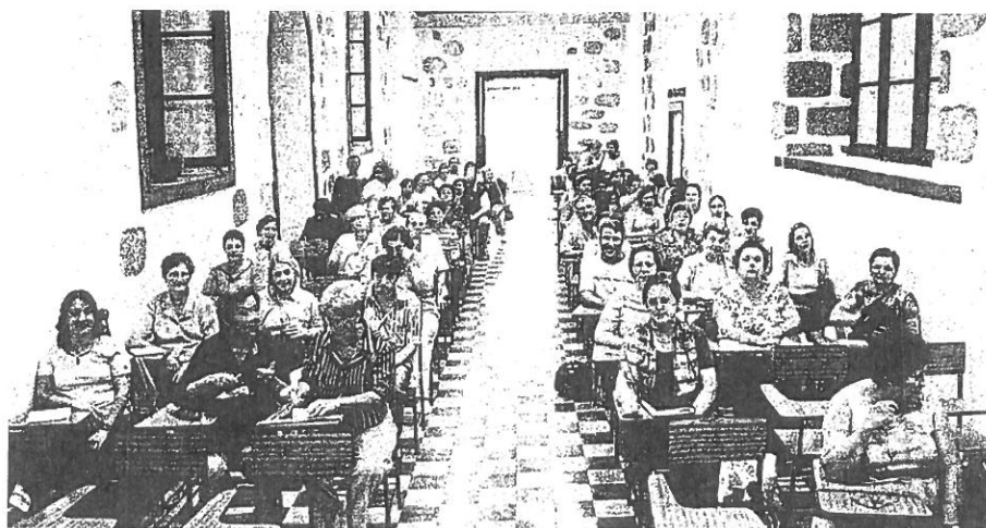
Reunión de responsables parroquiales de catequesis (8-11-2002)

El trabajo se inició con una amplia encuesta para tomar el pulso a la realidad, buscando la implicación de todos los agentes de pastoral y de manera especial los catequistas.