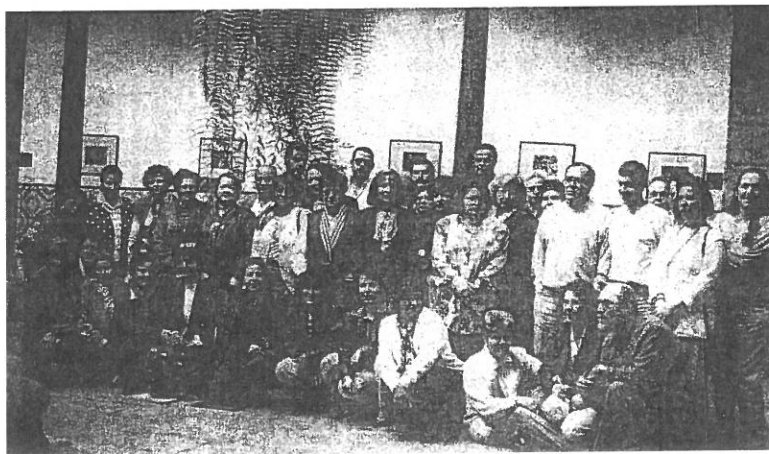
Escuela de Catequistas de adultos de Las Palmas de G.C. 16 de abril de 1994

Estos encuentros eran de tipo celebrativo o formativo según los casos y la participación rondaba las cincuenta personas.