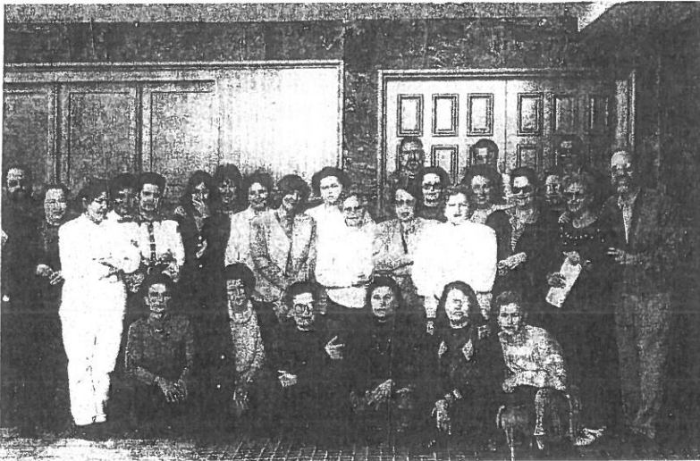
Escuela de catequistas de adultos en Lanzarote 21 de enero de 1995

Todo el esfuerzo que se realizó en el Sínodo, no impidió continuar la actividad de mantenimiento, fundamentalmente de las Escuelas de Catequistas de Adultos y el fortalecimiento del Departamento de Catequesis especiales y continuar con la elaboración de las dos carpetas restantes. La tercera fue asumida fundamentalmente por el equipo de la Diócesis de Tenerife.