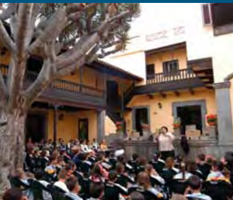
CUENTOS DE PEPA AURORA