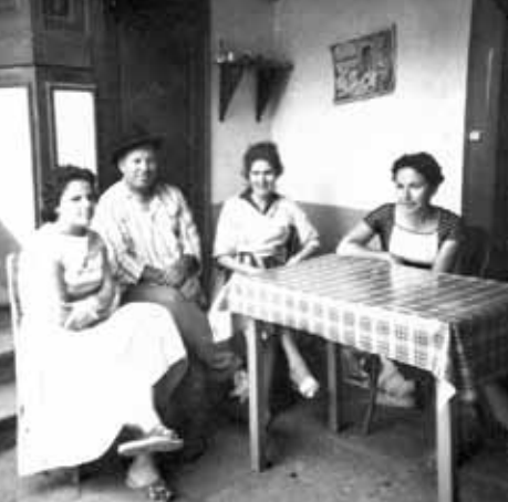
ESCENAS COTIDIANAS EN LA PARTE SUPERIOR DEL PATIO, ACCESO A LA COCINA Y DORMITORIO