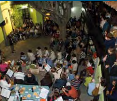
REPRESENTACIÓN DE LOS FINAOS