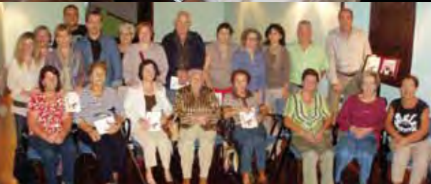
ENCUENTRO CON AUTORES

da entre los muros señoriales de la Casa de la Cultura a lo largo de sus cuarenta años de historia.