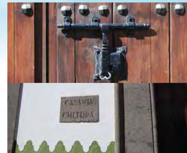
DETALLES EXTERIORES DE LA CASA DE LA CULTURA DE ARUCAS

madurar y hasta envejecer. No se trata, no obstante, de un envejecimiento pobre, sino de ver cómo ha pasado el tiempo sintiéndonos más cultos y felices, bajo la sombra