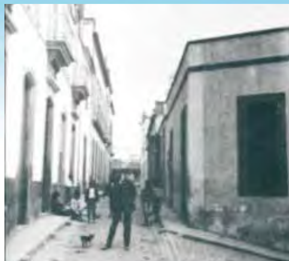
LA CASA DE LA CULTURA SE ENCUENTRA DESPUÉS DE LA LÍNEA DE LOS TRES BALCONES DE LA CASA DE LA FAMILIA BLANCO (C/ GOURIÉ, 1). APROXIMADAMENTE 1909-1910

Como es lógico, con el paso de los siglos, la casa fue sufriendo cambios en función de las necesidades de sus propietarios, rehabilitaciones y ampliaciones pero su historia es difícil trazarla, por el momento, durante los siglos XVIII y XIX. Por fortuna, hoy en día, nos encontramos con una esencia importante de su ser arquitectónico y las páginas de su vida vuelven a nosotros en el siglo XX. En una fotografía, datada aproximadamen-