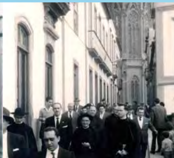
CALLE GOURIÉ, AÑOS 50 DEL SIGLO XX, EDIFICIO QUE AÑOS MÁS TARDES ALBERGARÍA LA CASA DE LA CULTURA