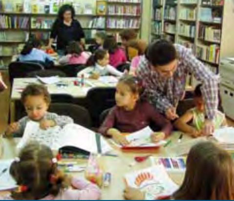
TALLERES EN LA SALA INFANTIL