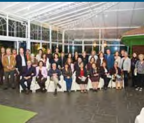
PARTICIPANTES DE UNA DE LAS EDICIONES DE 'RESCATANDO LA MEMORIA'