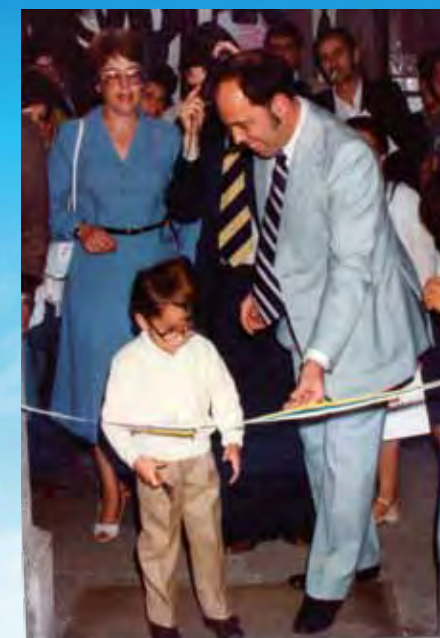
INAUGURACIÓN DE EXPOSICIÓN DE FILATELIA