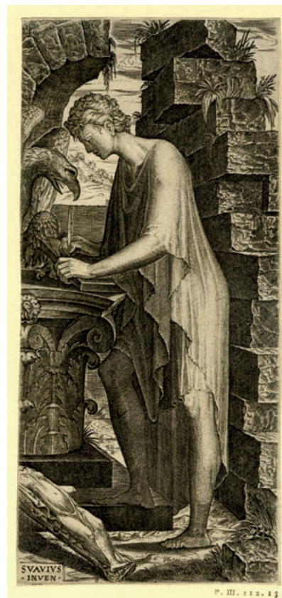
FIG. 4: Lambert Suavius, San Juan Evangelista Museo Británico, Londres.