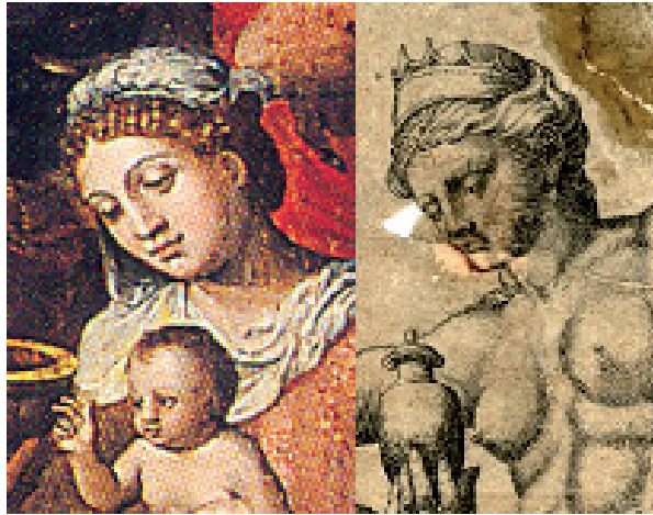
FIG. 18: Lambert Lombard, La Adoración de los Reyes (detalle), Iglesia de San Juan Bautista, Telde. FIG. 19: Suavius según Rafael, Venus y Psique (detalle), Museo Británico, Londres.