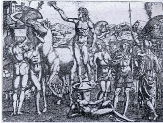
FIG. 7: Marcantonio Raimondi, Jeune Homme au Brandon .