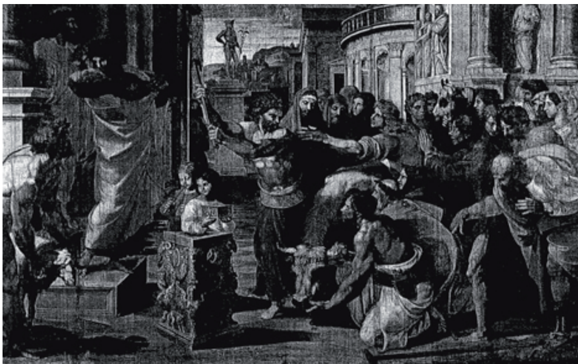
FIG. 28: Rafael, Sacrificio de Listre , Victoria and Albert Museum, Londres,.