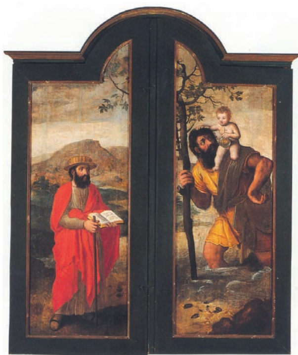
FIG. 2: Lambert Lombard, exterior del Tríptico de la Adoración de los Pastores , San Juan Bautista, Telde.