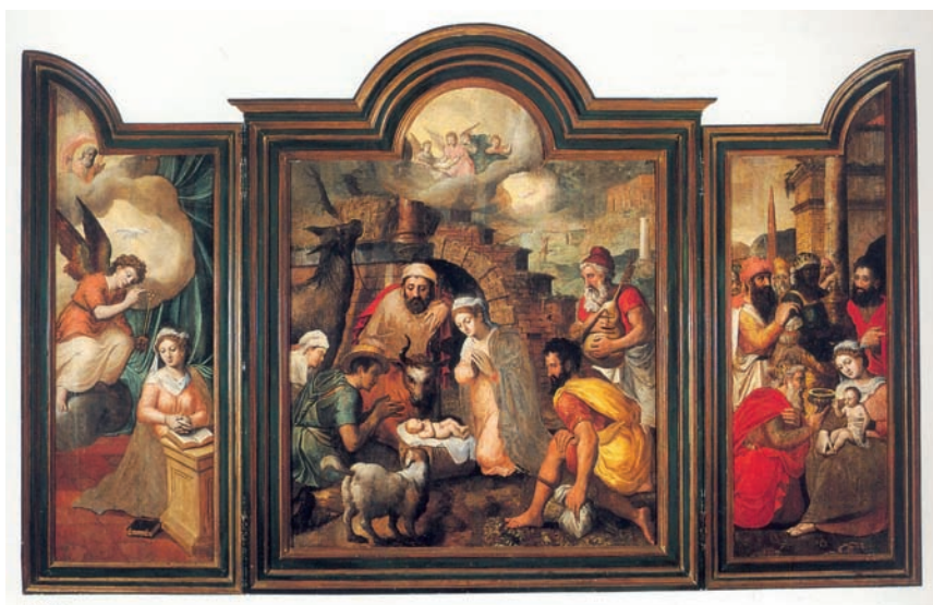
FIG. 1: Lambert Lombard, Tríptico de la Adoración de los Pastores , San Juan Bautista, Telde.