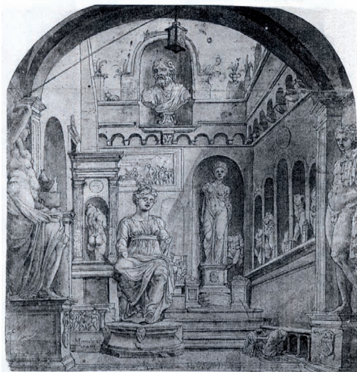
FIG. 21: Heemskerck, dibujo del Cortile del palacio Sassi en Roma.