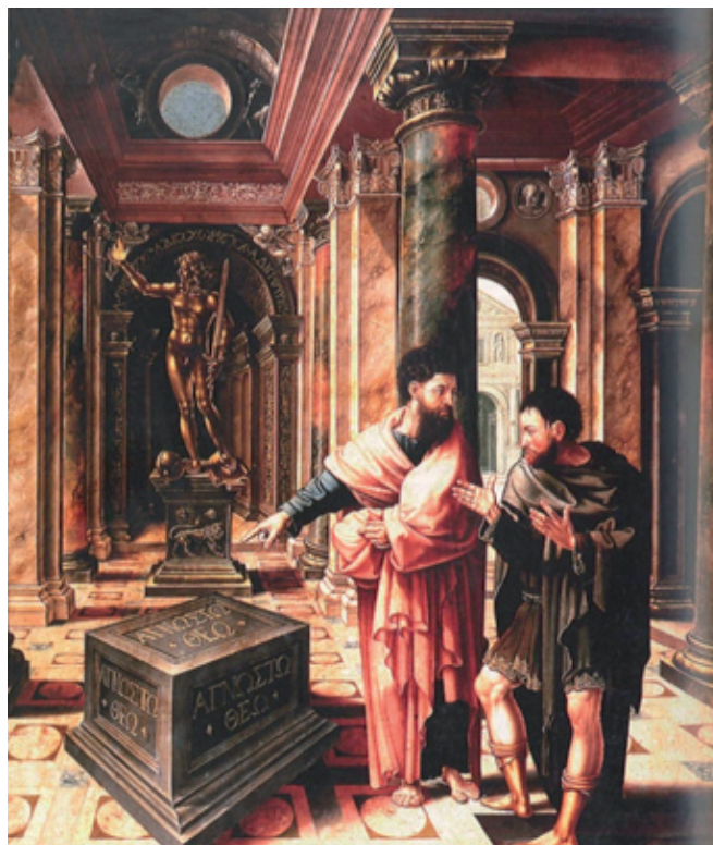
FIG. 5: Lambert Lombard, San Pablo ante el altar del dios desconocido , Museo de arte Valón, Lieja.