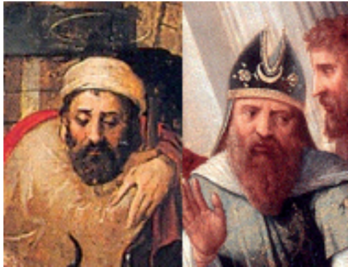
FIG. 23: Lambert Lombard, La Adoración de los pastores (detalle), Iglesia de San Juan Bautista, Telde.