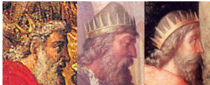
FIG. 8: Lambert Lombard, Adoración de los Reyes (detalle), tríptico de San Juan Bautista de Telde.