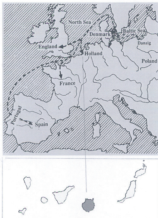
FIG. 34: Mapa de la presenciade Lambert Lombard en Europa y su última localización en las Islas Canarias.