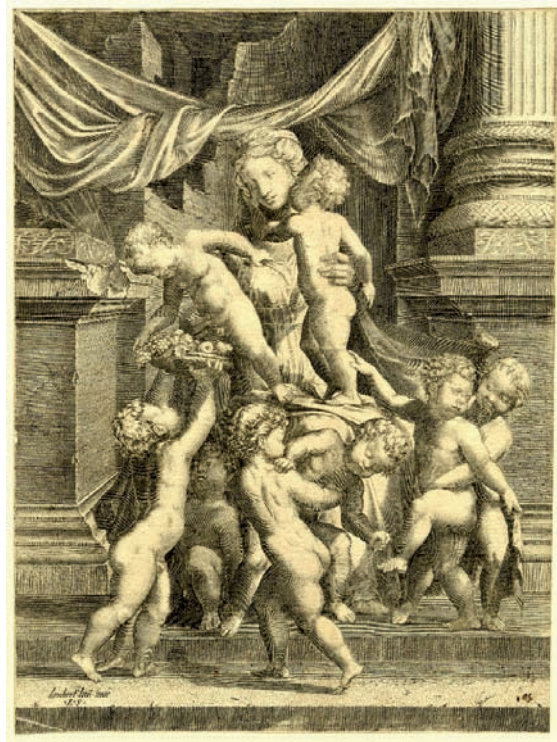
FIG. 11: Lambert Suavius según dibujo de Lambert Lombard, La Caridad .