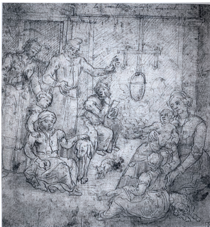
FIG. 22: Lambert Lombard, La Familia del pintor , Gabinete de estampas, Lieja.