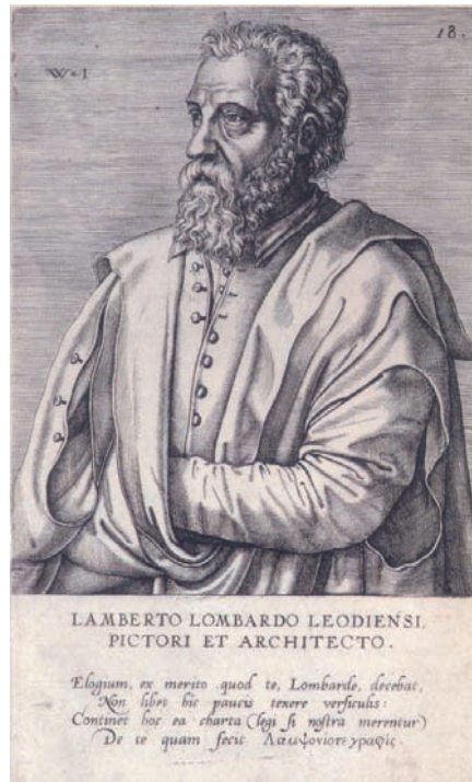
FIG. 3: Jan Wierix, Retrato de Lambert Lombard , en Domenicus Lampsonius, Pictorum Aliquot Celebrium Germaniae Inferioris Effigies , Amberes, 1572.