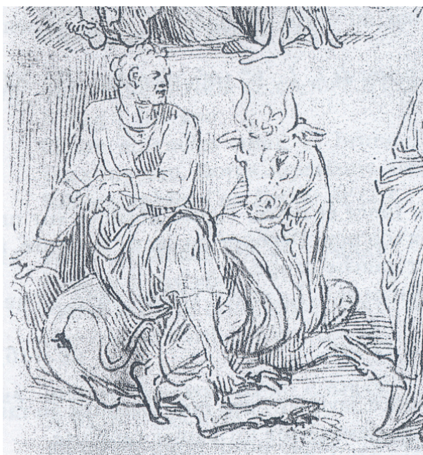
FIG. 27: Lambert Lombard, Los cuatro evangelistas (detalle de san Marcos), Gabinete de estampas, Lieja.