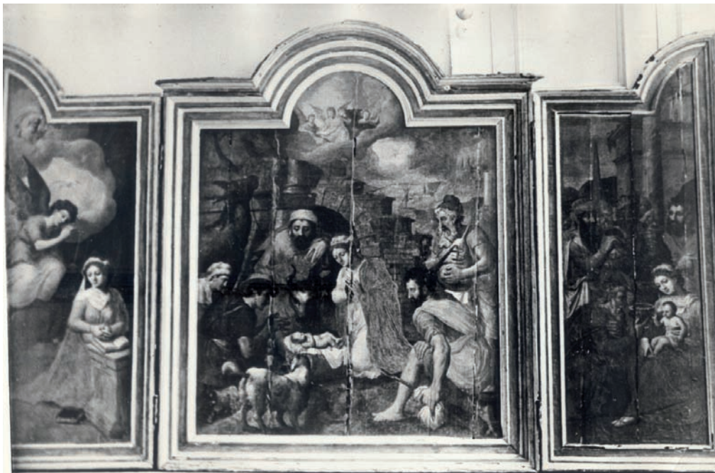
FIG. 29: Lambert Lombard, Triptico de San Juan Bautista (antes de la restauración), Telde.