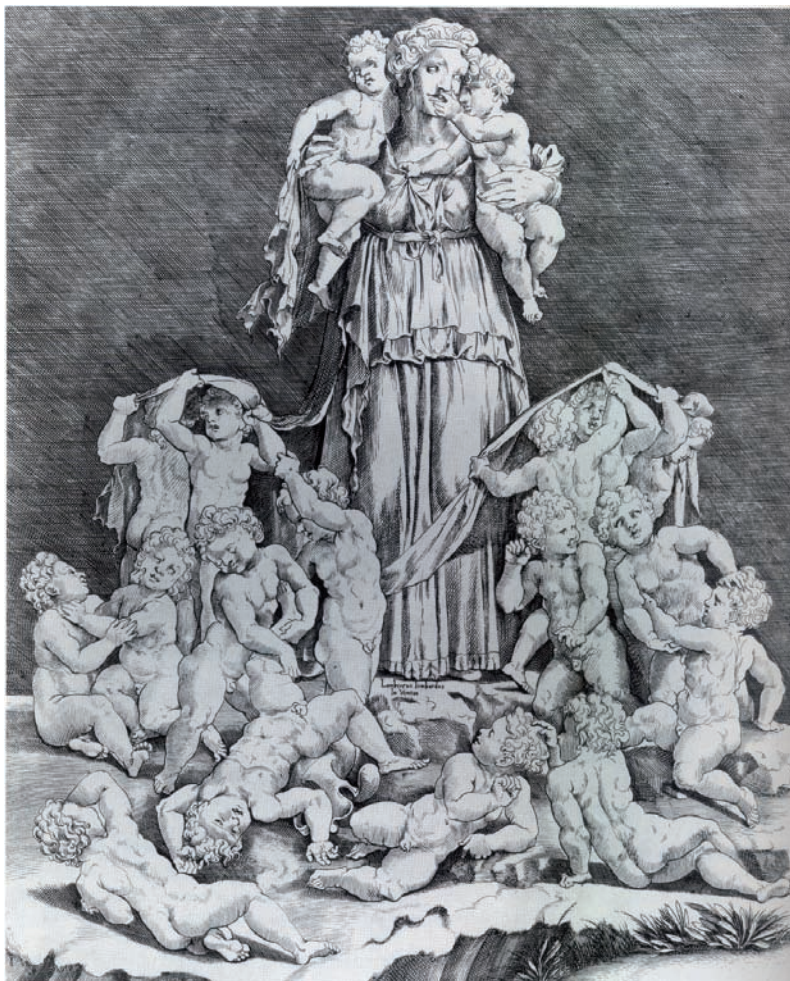
FIG. 20: Lambert Lombard, Caridad , Biblioteca Real, Bruselas.