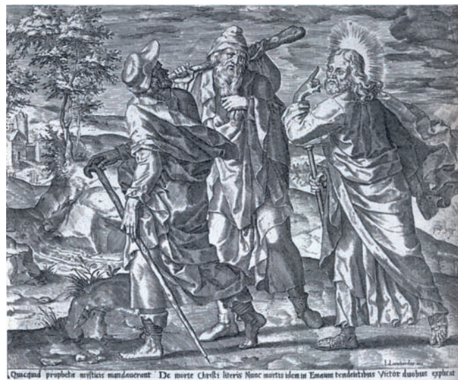
FIG. 26: Lambert Lombard, Discípulos de Emaús , Gabinete de estampas, Lieja.