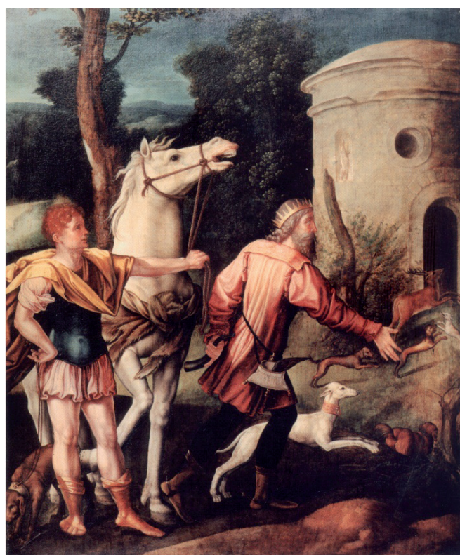
FIG. 6: Lambert Lombard, El rey descubriendo la tumba de san Denis , Iglesia de San Denis, Lieja.