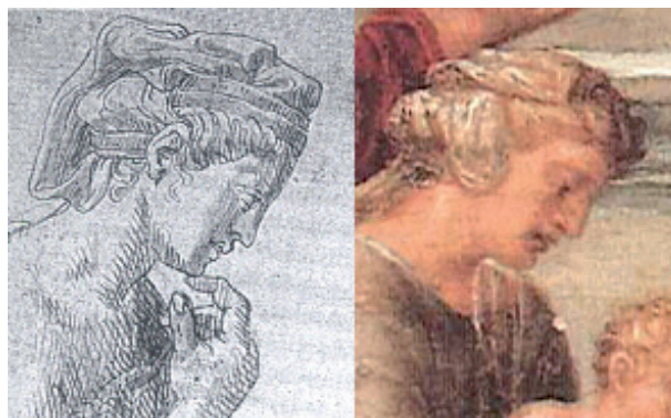
FIG. 32: Lambert Lombard, Cristo y la Samaritana (detalle).