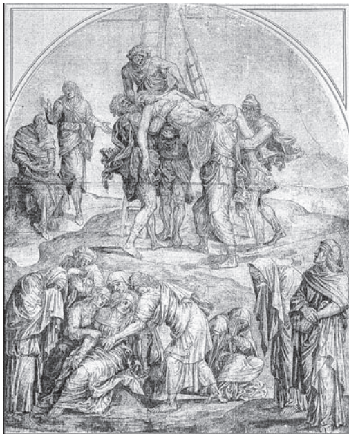
FIG. 25: Lambert Lombard, Descendimiento , Gabinete de estampas, Lieja.