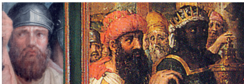
FIG. 16: Lambert Lombard, David y Abigail (detalle).