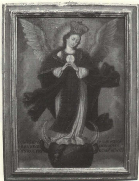
Figura 1. Pintura de Nuestra Señora del Patrocinio.

Salvada en una isla por Poseidón, pare a su hijo, Apolo, que da muerte al dragón» 13 . A todo ello se le viene a sumar la explicación dada por los teólogos medievales que afirman que las dos alas de águila que se le dan a la mujer para que escape del dragón simbolizan los dos Testamentos o las dos manos de Cristo crucificado.