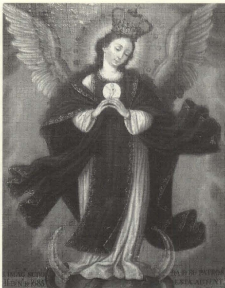
Figura 4. Detalle de la pintura.