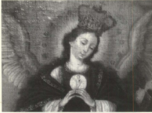
Figura 2. Detalle de la pintura.

generalmente se la representa de pie, sobre un creciente de la luna con la frente ceñida por doce estrellas, como la mujer del Apocalipsis, de modo que a veces tienden ambos temas a confundirse, interpretándose cada uno de sus símbolos de la siguiente manera: la luna que ella pisa simboliza las cosas cambiantes del mundo terrenal, mientras que las doce estrellas que circundan su cabeza son una alusión a los doce apóstoles reunidos en torno a su lecho de muerte. La mujer apocalíptica que escapa del dragón sería la imagen de la mujer elevada al cielo, la Asunción pero, a causa de una confusión iconográfica, la Asunción pierde su carácter original para convertirse en Ascensión , donde en vez de ser elevada al cielo por ángeles, Ella vuela sola ante el asombro de los apóstoles, apareciendo incluso —en ocasiones— provista de grandes alas de águila, como las que el Apocalipsis le atribuye a la mujer perseguida por el dragón 15 .