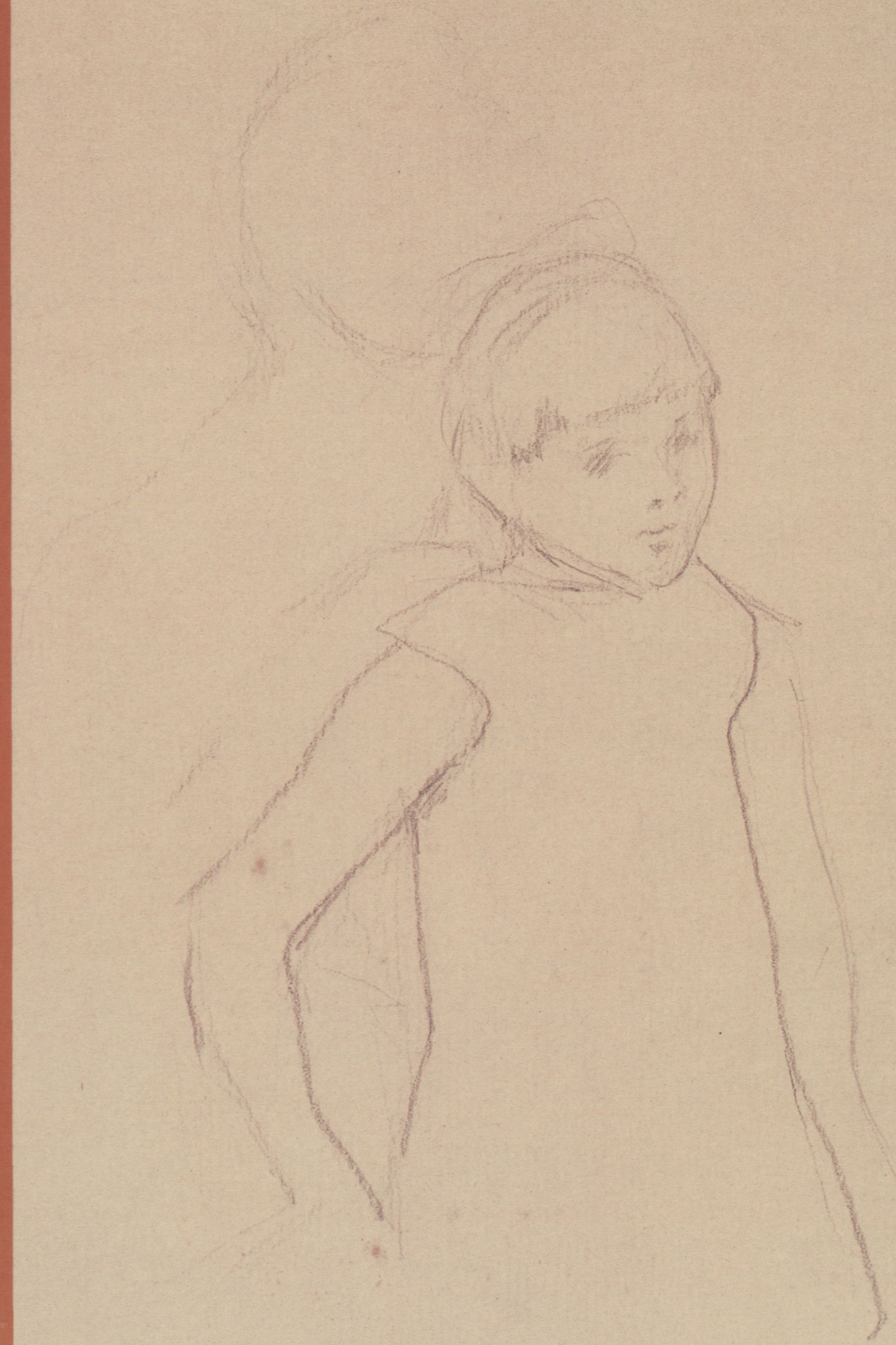
MARY CASSAT Study of a Young Girl ca. 1920 Lápiz sobre papel 22,5 x 14,5 cm